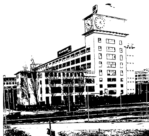
Hoofdingang van het Natlab.