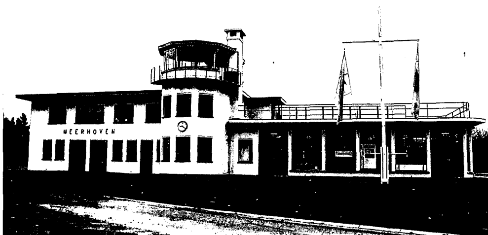
Luchthavengebouw Welschap.

drukken op de gebouwen en inmiddels ook de ontwerpen had gemaakt voor de overige gebouwen aan en rond de Emmasingel. Het gebied tussen Emmasingel en Willemstraat en de spoorlijn naar 's-Hertogenbosch werd vervolgens nagenoeg vol gebouwd. Dat gebeurde in een hoog tempo. Opvallend is dat daarbij de kantoorgebouwen en de laboratoria een meer representatief karakter kregen door de toepassing van baksteen, zoals bij de Bruine Heer al het geval was.