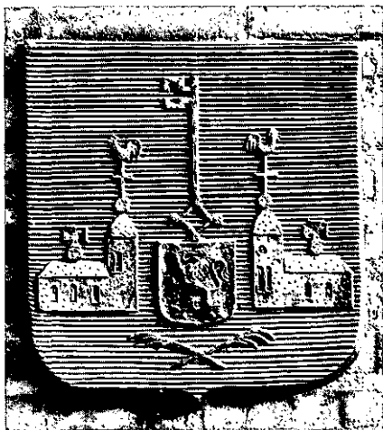
Het wapen van Vught bij het Administratiekantoor van de Gemeentesecretarie te Vught.

Van het oudste type („type A”) dateert de eerste afdruk die bekend is van 18 oktober 1353. 6) Deze bevindt zich in de archieven van de Duitse Orde te Vught. Het is een bijzonder gaaf en scherp uithangend zegel in groene was. Op alle drie de zegeltypen zijn de twee oudste parochiekerken van Vught es-