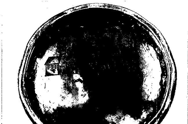
Onderzijde avondmaalsbeker Hervormde Gemeente Vught, 1670. (Foto: Jos Koldewey, juni 1983)

In 1400 of 1401 lieten de schepenen een nieuw stempel („type B”) maken, dat nu nog te zien is op de Vughtse Oudheidkamer. Het zegelveld is nog gaaf, de rand deels afgesleten. De oudste afdruk die bekend is, dateert van 2 okto-