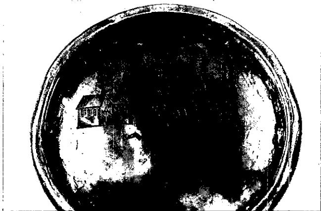
Onderzijde avondmaalsbeker Hervormde Gemeente Vught, 1670. (Foto: Jos Koldewei, juni 1983)

In 1400 of 1401 lieten de schepenen een nieuw stempel („type B”) maken, dat nu nog te zien is op de Vughtse Oudheidkamer. Het zegelveld is nog gaaf, de rand deels afgesleten. De oudste afdruk die bekend is, dateert van 2 oktober