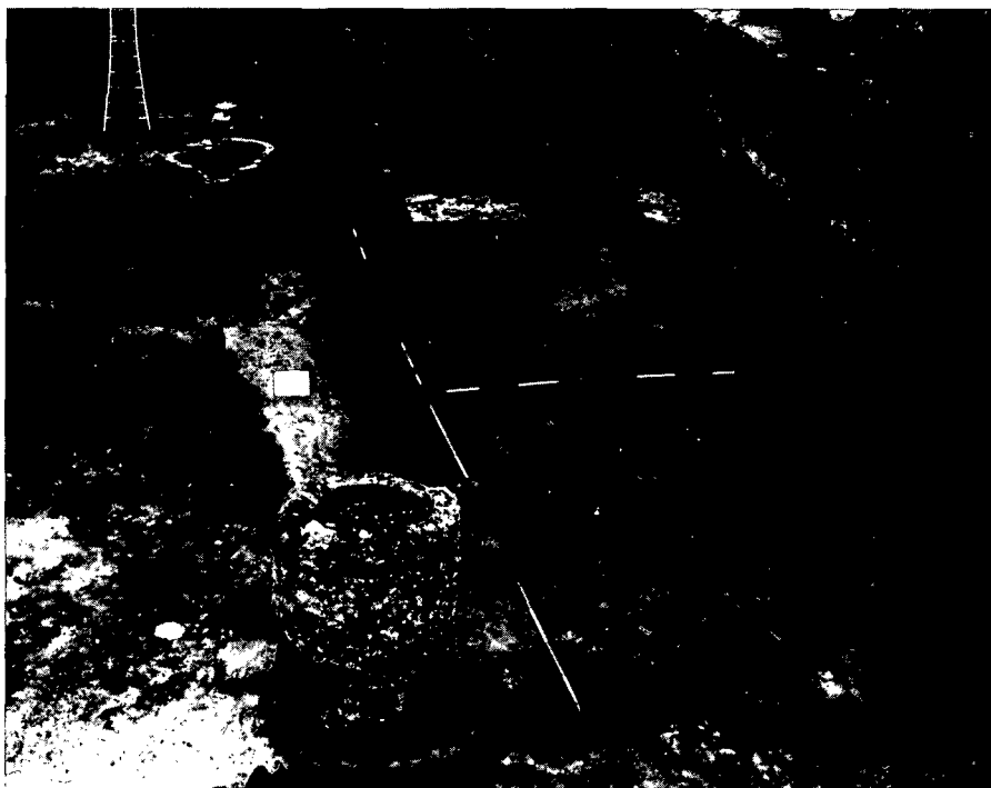
Afbeelding 2. Opgraving Postelstraat 1978 (Opgravingsput IV, uit noorden). Op de foto zijn iets links van het midden twee rijen houten palen te zien, die het westelijk uiteinde begrensd van het hoofdgebouw van de Uithof van de abdij van Postel uit de bouwperiodes III en IV (13e eeuw). Westelijk van het huis, iets rechts van het midden, een vis(?)vijver (periode III). De ronde putten zijn 16e en 17e eeuwse beerputten. De rechthoekige blokken op de achtergrond zijn funderingen voor (een muur op grondbogen) van het Refugiehuis van Postel (bouwperiode VI, einde 14e eeuw).

België nog niet eerder volledig zijn opgegraven.