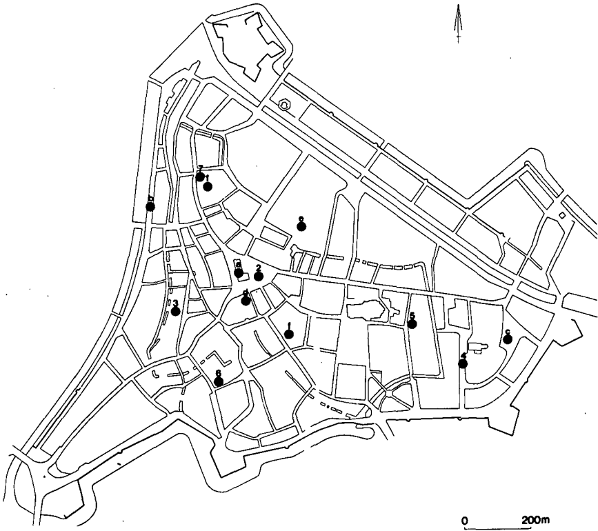
Afbeelding 1. Archeologisch onderzoek in de binnenstad 1976-1980.