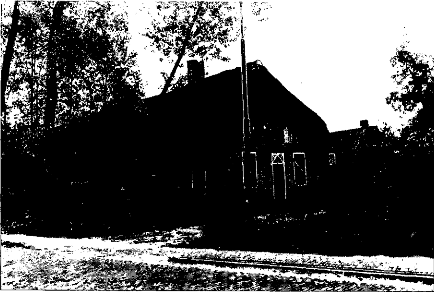
9. Liempde, Kapelstraat 22, beschermd monument.