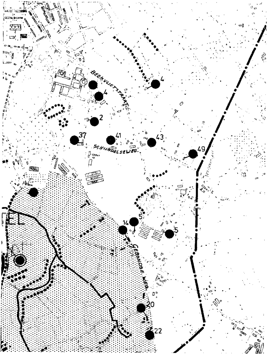
7. St.-Michielsgestel, inventarisatiekaart van de omgeving van Beekvliet, schaal 1:10.000. Raster: oude akkerbodems, waterlopen en dijkes: doorlopende lijnen en stippels, de objecten met stip en de beschermde objecten extra omcirkeld (voorlopige kaart).