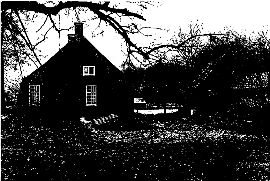
1. Oirschot, Termeidensteeg 2, vermoedelijk 17e-eeuwse „Einzelhof” en tot nu toe onbeschermd.

Het is in ieder geval noodzakelijk foto's te maken van de voor- en achtergevel en eventuele bijzondere details als hekken, bovenlichten, stootstenen, etc (afb. 2, 3, 5). Op een veldformulier wordt een aantal gegevens opgenomen dat later op een archiefkaart opgenomen wordt. Afb. 4 en 6 geven een tweetal voorbeelden van het tot nu toe in Brabant gebruikte formulier. Daarnaast wordt het object op een kaart 1:10.000 aangegeven (afb. 7). Voor de kernen kan ook een schaal van 1:1.000 of 1:2.500 gebruikt worden. De gemeentegrenzen, waterlopen en dijken,