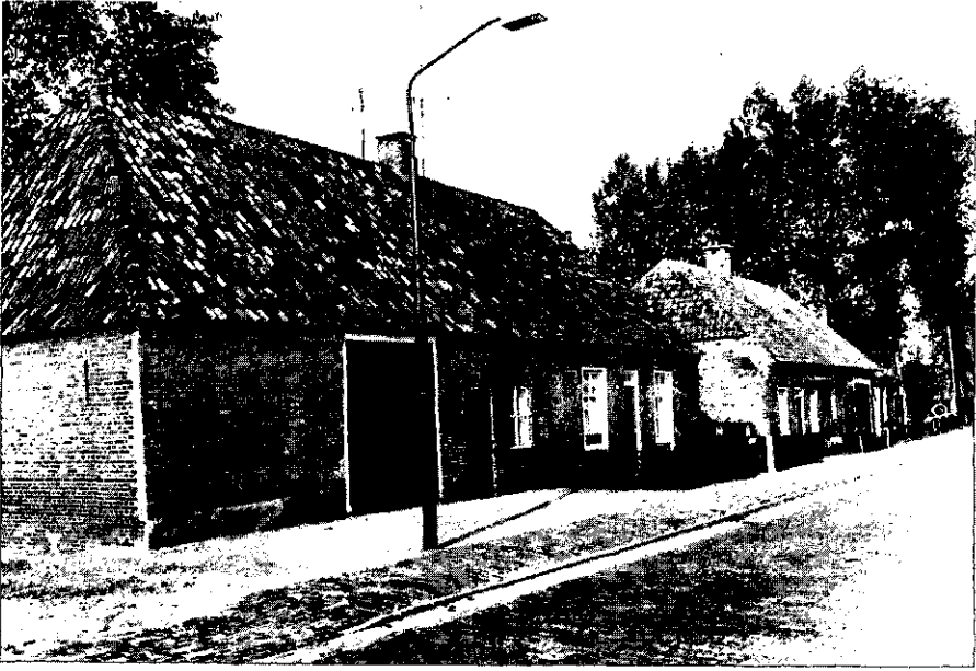
8. Liempde, Kapelstraat, straatbeeld.