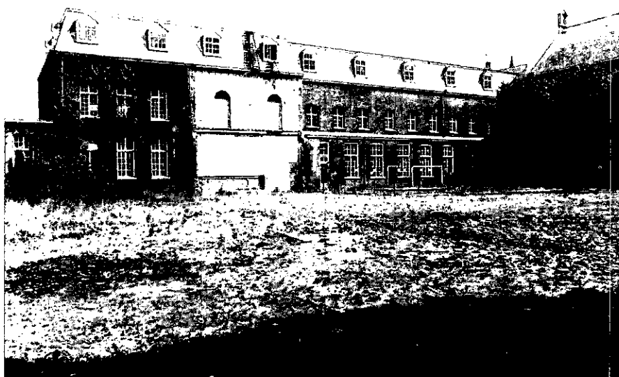
3. Hetzelfde gebouw, de achtervleugel uit 1827-31 met uitbreidingen uit 1855 en 1888 en een kap van 1904-07.