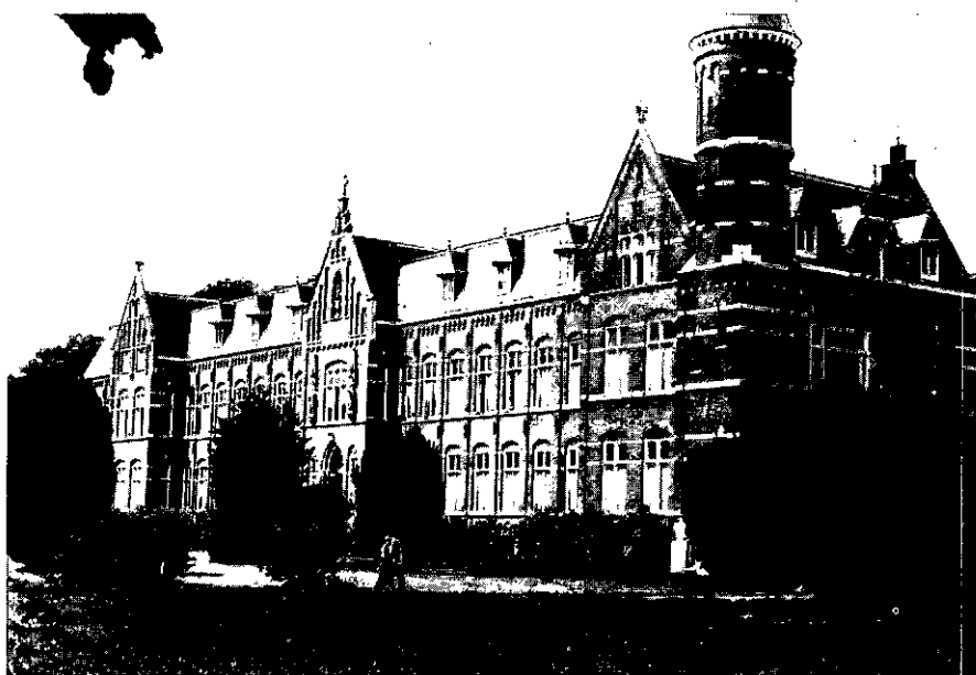
2. St.-Michielsgestel, klein-seminarie Beekvliet. Hoofdgebouw van Th. van Aalst, 1907-18.