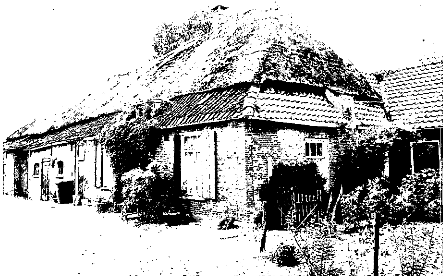
5. St.-Michielsgestel, Beekkant 26-26a.

In deze straat worden meerdere panden afzonderlijk beschreven: No. 22 (afb. 9). Kortgevelboerderij onder wolfdak, XVIII- XIXm. Dak gedekt met riet en Oudhollandse pannen. Eenvoudig bovenlicht en zesruits schuiframen. Geheel ongewijzigd.