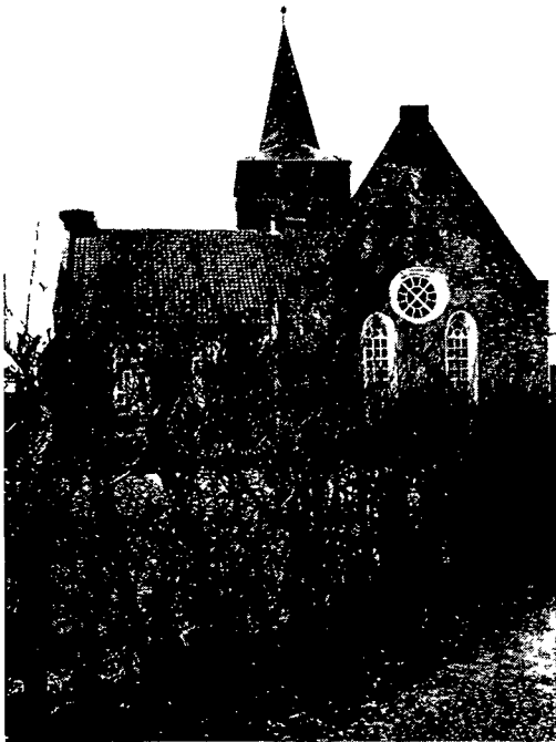
Afb. 1 Oostgevel van het koor der Ned Herv. Kerk te Veen.