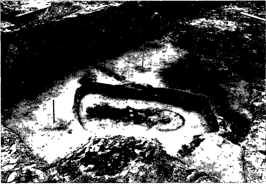
Afb. 1. Cuyk. Vlakgraf met sporen van een lijksilhouet, waarschijnlijk daterend uit de Bronstyd

vuurstenen artefacten, o.a. spitsen, boren, klingen en schrabbers; vlak ten noorden daarvan werd het spoor gevonden van een paal die naar het zuiden gericht is geweest. Tot dezelfde tijd behoren naar alle waarschijnlijkheid twee, wellicht drie, verschillend georiënteerde vlakgraven, waarin slechts enkele vage sporen van lijksilhouetten te zien waren.