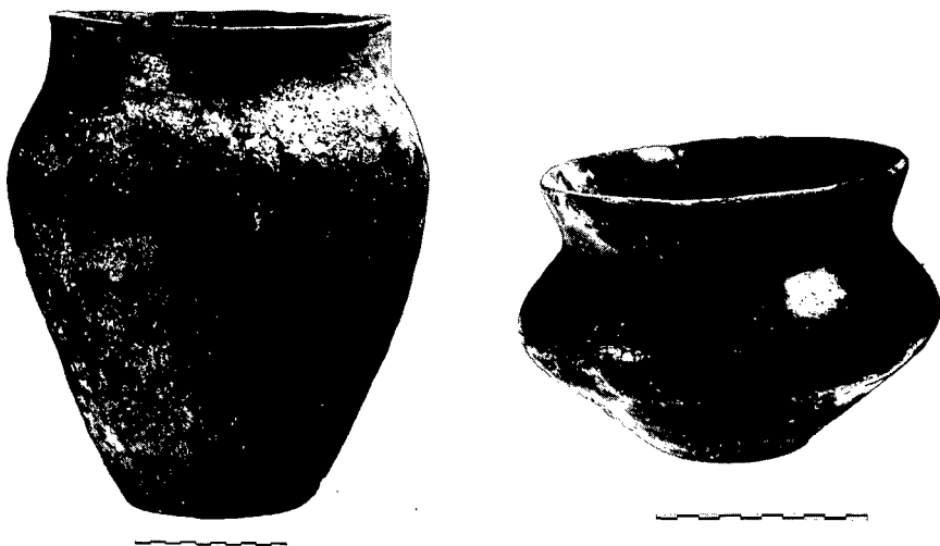
Fig. 2. De beide vroege-IJzertijd urnen van de Tommel te Baarle-Nassau.

„Door landbouwer Van der Vloet te Baarle-Nassau zijn twee vazen bij het verrichten van graafwerk uit de heide te voorschijn gebracht. De eene vaas is nog in goeden staat, de andere aan stukken. Men denkt dat ter plaatse een romeinse begraafplaats is geweest”.