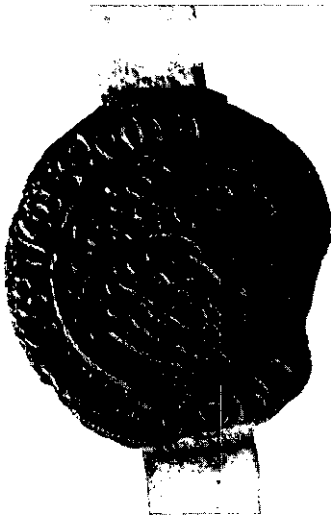
Afbeelding van het oudst bekende zegel van de Vrijheid Oerle. Hiermede werd de acte van Vereniging en Vriendschap van 8 maart 1355 bezegeld. Opschrift: SIGILLUM COMMUNE LIBERTATIS DE SANDOERLE.

zaken uit deze verklaring leert ons het volgende: