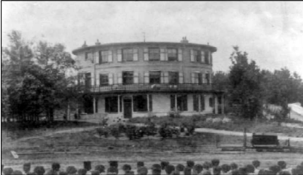
Het Ronde Huis met ervoor het 'Lorrelijntje' met enkele lorries en de kipwagen

Voor het 'Ronde Huis' was een wissel richting het 'Ronde Huis'. Het lijntje liep langs de varkensschuren aan de linkerkant en een boomgaard aan de rechterkant, links van het 'Ronde Huis', naar de koeschuren.