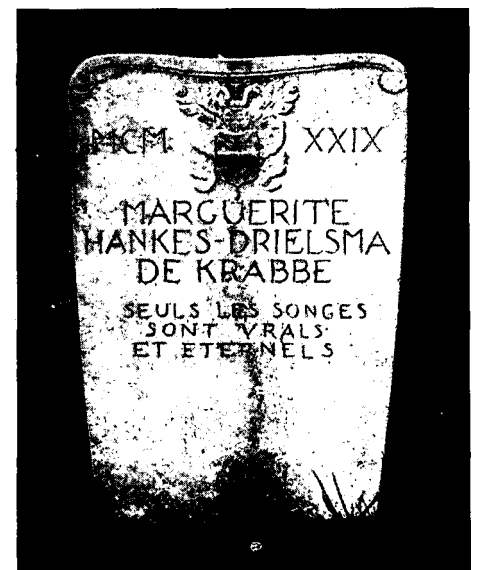
Fraaie vorm van grafsteen; uitstekende verdeling van het vlak en karaktervolle letter

voor de Monumentenzorg. Hij is zich er terdege van bewust dat er binnen de Rijksdienst tot op heden te weinig aandacht is voor dit onderdeel van ons cultureel historisch verleden. Er is nauwelijks sprake van onderzoek en te weinig monumenten zijn beschermd. Toch is interesse groeiende, niet in de eerste plaats voor de dodencultuur, maar voor de vreedzame uitstraling, de rust, de vogels en de beplanting. Begraafplaatsen in tegenstelling tot kerkhoven dateren van na 1825, toen bij Koninklijk Besluit het begraven binnen de steden om hygiënische redenen verboden werd. De kerken die financieel afhankelijk waren van het begraven in en om de kerk kregen een geldelijke compensatie toegezegd.