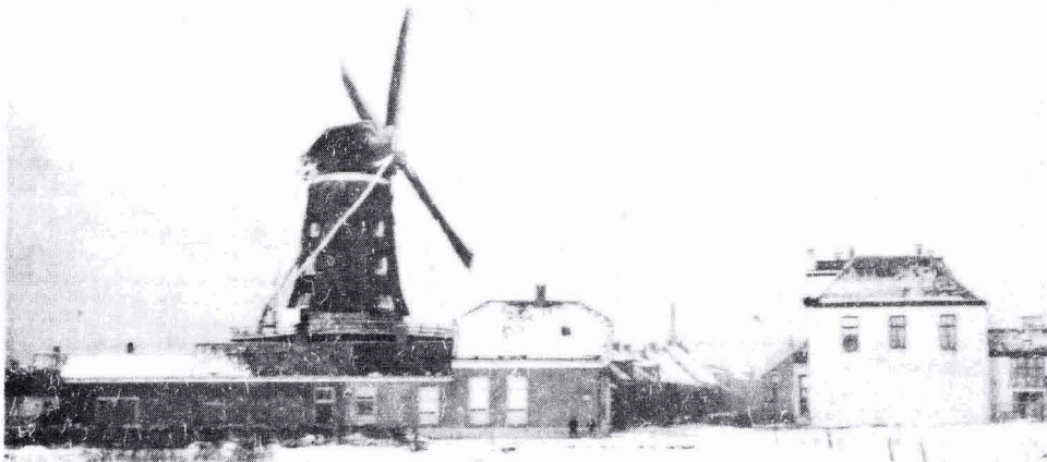
De Rietmolen of Heusinkveldmolen.