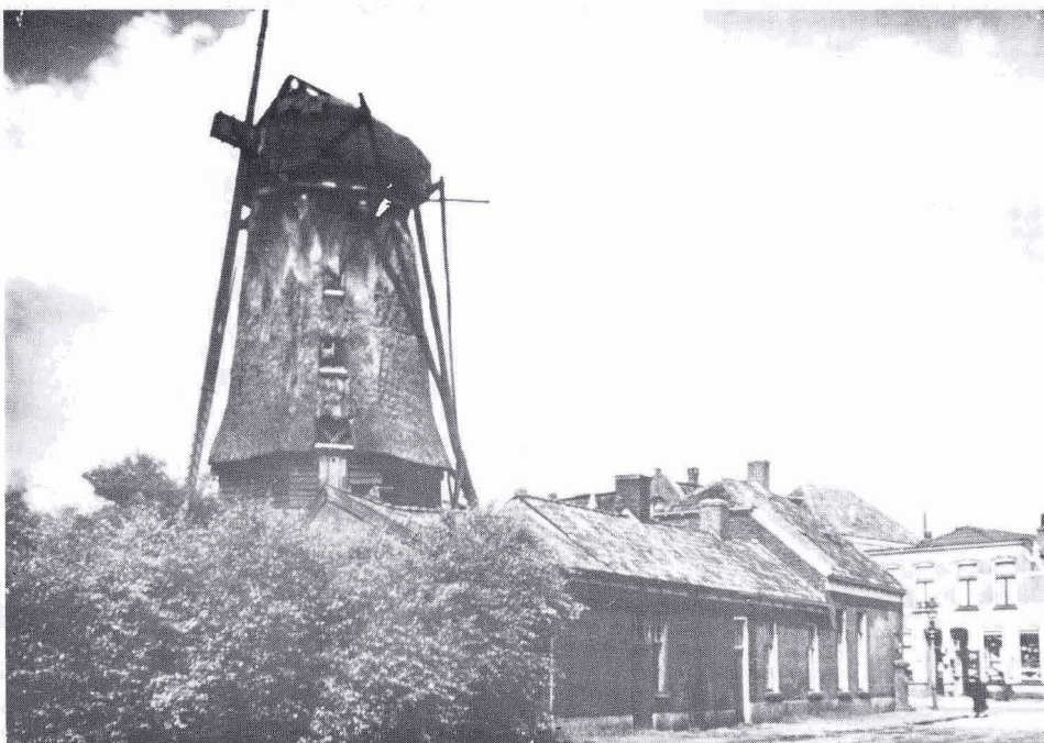
De reeds gehavende Heusinkveldmolen aan de Brinkstraat, hoek Spelbergweg. Nu staat op deze plek de Renatakerk.