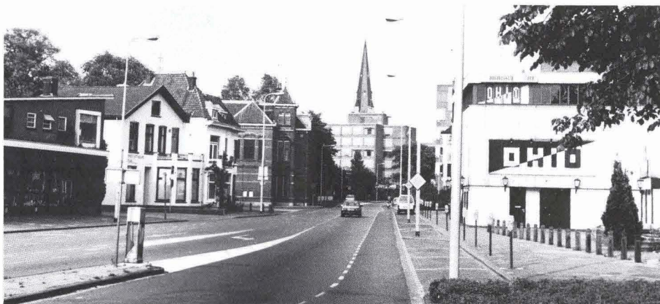
De Molenstraat, gezien vanaf de Hengelosestraat met rechts de discotheek Ohia, de plek waar de Noordmolen heeft gestaan. Op de achtergrond de toren van de St. Jozefkerk.

De Noordmolen had nog geen bewegende kap, zodat de wieken naar het noordwesten gekeerd waren om zo van zoveel mogelijk wind verzekerd te zijn. De bewegende kap werd pas tegen het einde van de zestiende eeuw, vermoedelijk in Vlaanderen, uitgevonden. De burgers van Enschede waren verplicht hun koren in de stadsmolen te laten malen. De molen was eigendom van de stad en werd tot 1781 onderhands en later publiek verpacht. De opbrengst van de molen maakte een belangrijk deel uit van de inkomsten van de stad.