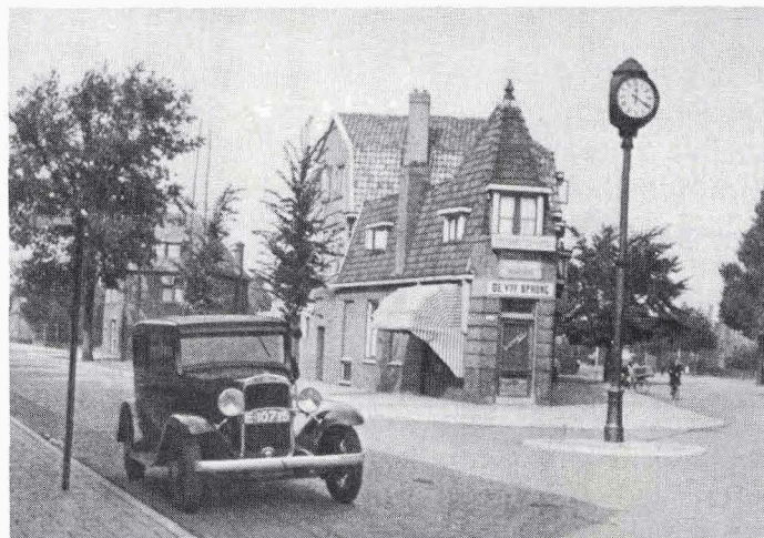
Het pand Deurningerstraat 217 ‚De Vijfsprong‘.