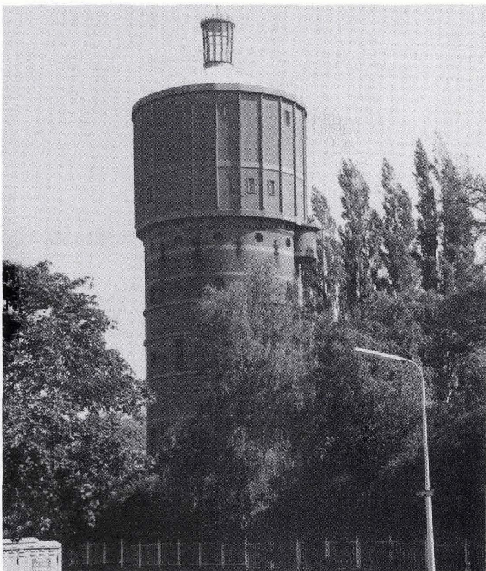
De watertoren op Hoog en Droog met een glazen koepeltje erop dat naar alle kanten een prachtig uitzicht biedt op de stad. De toren is echter niet voor het publiek toegankelijk.

Bewerkt naar gegevens van Karel Brouwer (†).