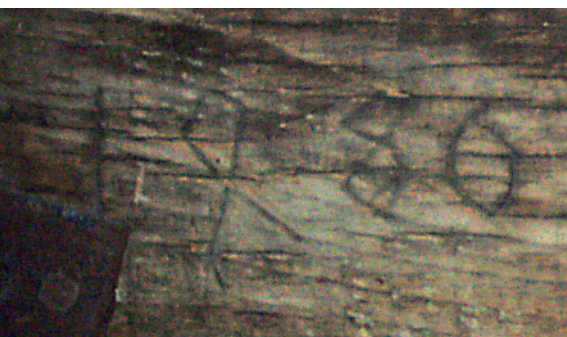
Afb. 2. Het jaartal 1480.

Deze bouwgeschiedenis is deels af te lezen aan de voorgevel aan de Zaadmarkt. We zien hier een gevel die ontstaan is rond 1820, maar die als het ware vóór die twee panden is gezet. De erker met de voordeur behoren daarbij aan het vroegere linker pand, de beide ramen rechts behoren tot het oorspronkelijke rechter pand. Het zichtbare gedeelte van het dak laat zien dat de beide kapconstructies eveneens bij elkaar zijn getrokken door een dakschild hiertussen boven de gevel te formeren.