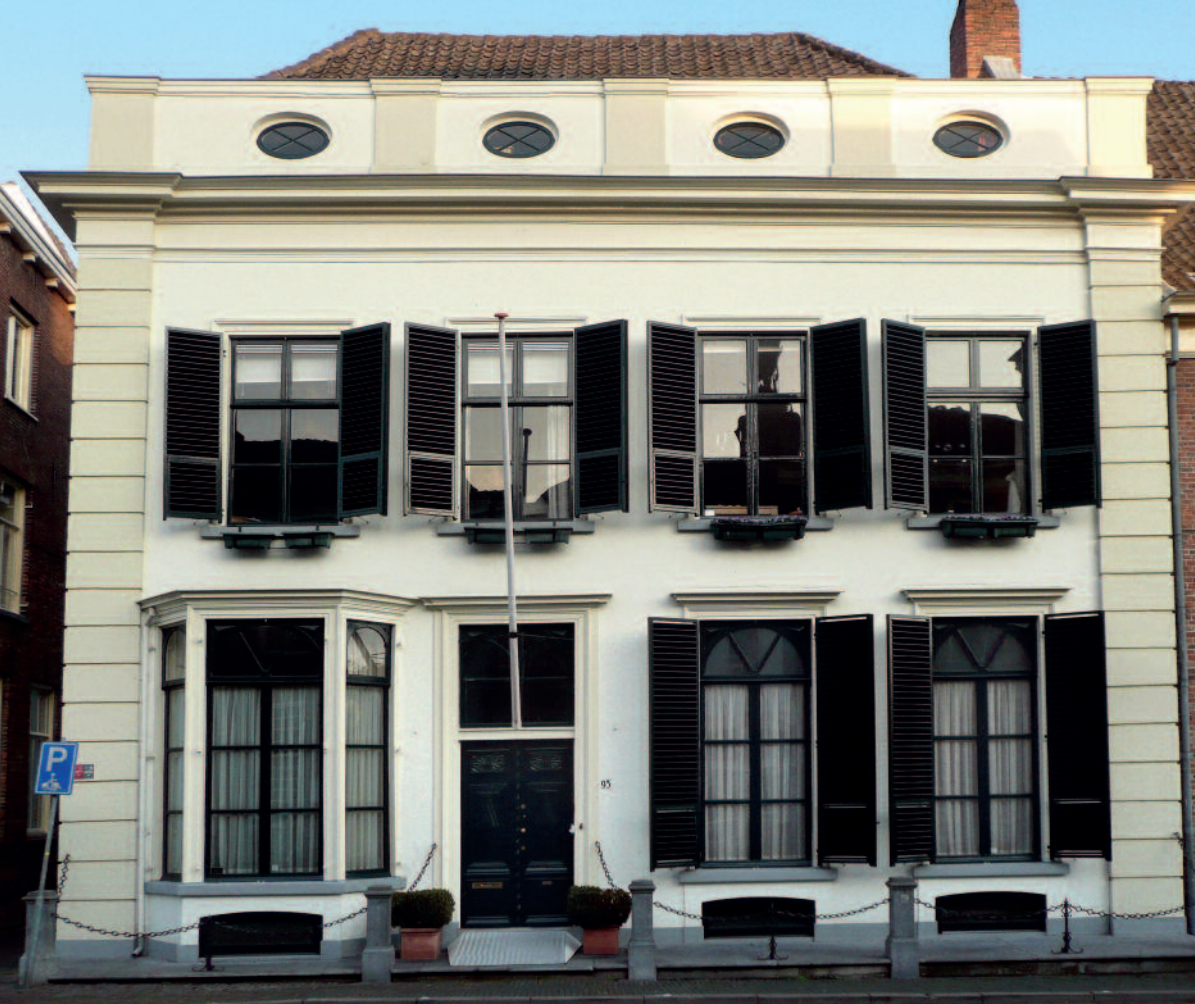
Afb. 1. Zaadmarkt 93, voorgevel.