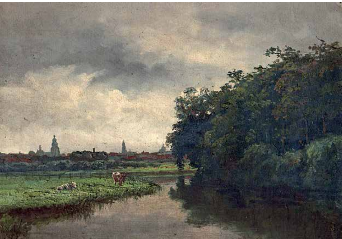
Gezicht op Zutphen, olieverf op doek, 26 × 36 cm. (particuliere collectie, Delden)

een driewieler waarmee hij zijn schildersspullen vervoerde, en door zijn grote baard: 'hij zag eruit als Sint-Nicolaas'. Hij kocht zelden nieuwe kleding; zijn sokken en jaegerondergoed liet hij stoppen.