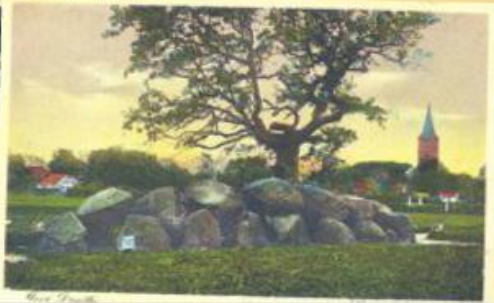
Van alle hunebedden zijn die van Rolde wellicht het vaakst op een ansichtkaart afgebeeld. Op de ansichtkaart rechtsboven is links de passerende trein te zien.