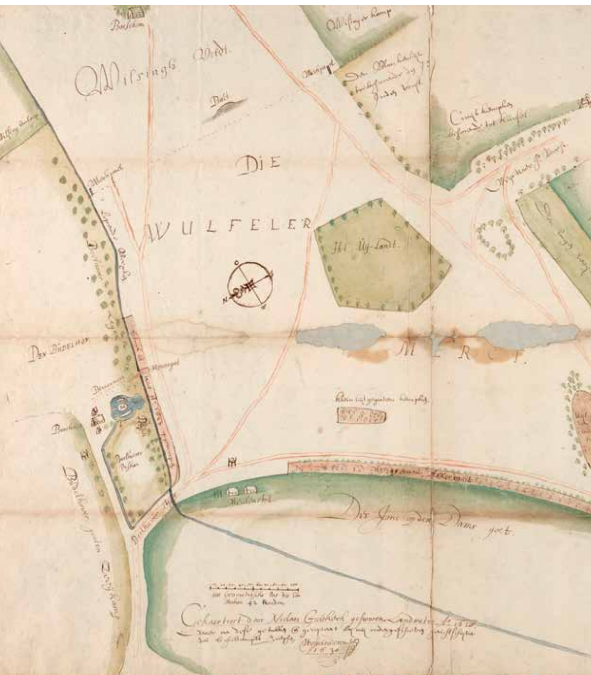
Kaart bij het proces Van der Capellen contra Van der Capellen, formaat 44 × 58 cm. Het zuidoosten ligt boven. De tekst onder op de kaart luidt: Gekaerteert door Niclaes Geelekerk, gesworen landmeter Ao 1628, waer nae dese getrokken ende gecopieert bij mij ondergeschreven gerichtschrijver des Schultampts Zutphen, H. van Swinderen 1630. (Regionaal Archief Zutphen)