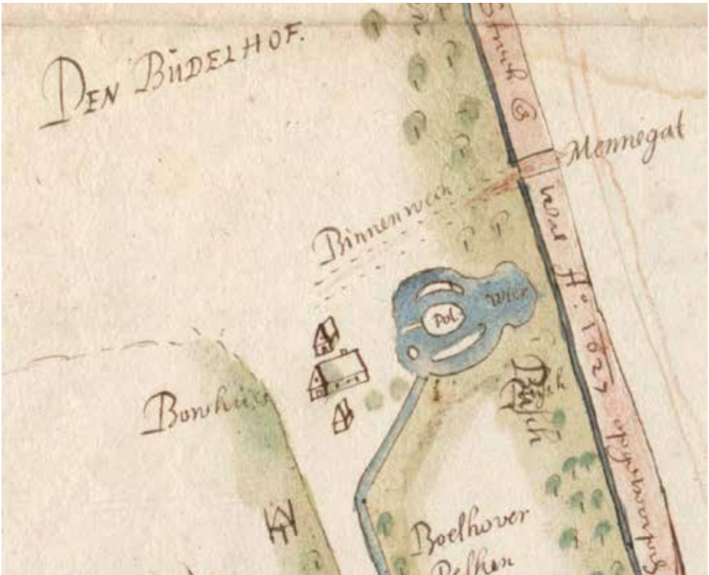
De Boedelhof. We zien alleen het bouwhuis en wat bijgebouwen. De Boedelhof werd verwoest in de Tachtigjarige Oorlog. Het eilandje De Pol was de plaats van het huis. In 1638 werd de Boedelhof weer opgebouwd. Nu is alleen het linkerbouwhuis er nog. We zien hier ook de in 1627 opgeworpen wal en het mennegat, waar het proces over ging. (uitsneden uit de kaart van Van Geelkercken, Regionaal Archief Zutphen)