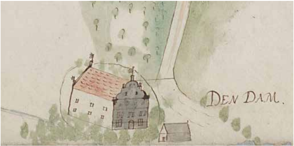
Huis Den Dam. Het huis uit 1559 werd in 1765 geheel verbouwd en kreeg vervolgens in 1875 het huidige aanzien.