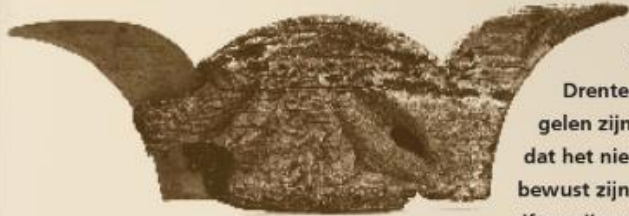
Houtsnijwerk afkomstig uit het Bolleveen bij Zeijen (Foto: Provincie Drenthe).

De venen en veentjes een belangrijke rol speelden in het leven en denken van de pre- en protohistorische Drenten, staat buiten kijf. Tijdens het veensteken en veenbeugelen zijn zoveel gewone en bijzondere voorwerpen aangetroffen, dat het niet anders kan of die moeten daar in het verre verleden bewust zijn neergelegd. De meeste archeologen nemen aan dat het giften zijn voor bovennatuurlijke machten. Maar welke vorm die