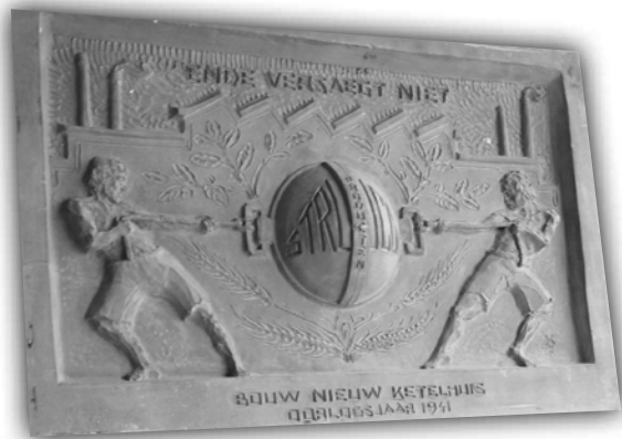
Afb. 2 Wat van Strucol bewaard gebleven is: de herdenkingssteen die in 1941 is ingemetseld bij de bouw van een nieuw ketelhuis. De steen bevindt zich nu bij de entree van het appartementencomplex. Het motto 'ende versaegt niet' lijkt betrekking te hebben op het oorlogsjaar 1941: 'en verlies de moed niet' (volgens het Woordenboek der Nederlandsche Taal: 'vaak in den context van strijd en oorlog'. De beide mannen trekken (tevergeefs) aan de Maagdenburger halve bollen. Zo ongelooflijk is de kleefkracht van de Strucol-producten!

In 1874 verloor Zutphen de status van vestingstad. Maar het duurde nog tot 1892 voordat de gemeente het Hoornwerk kon verwerven. Tussen 1887 en 1913 moet het ravelijn vóór het Hoornwerk zijn geruimd, achter wat nu de Badhuisweg is. Rond 1900 vestigden zich aan de noordkant van het Hoornwerk bedrijven. Coöperatie Het Volksbelang bouwde er een bakkerij; de belangrijkste vestiging was wel Kleefstoffenindustrie Gebr. Struyck (Strucol), later National Starch Chemicals (NSC) geheten. Deze fabriek begon in 1901 als toeleverancier van papierlijm voor de papierindustrie. Er kwamen niet alleen bedrijfsgebouwen; rond 1925 werden er vijf woningen gebouwd op het Hoornwerk (zie omslagafb.). In 2007 vond volledige kaalslag van het NSC-terrein plaats en werd alle bebouwing gesloopt ten behoeve van het 'inbreidingsplan'.