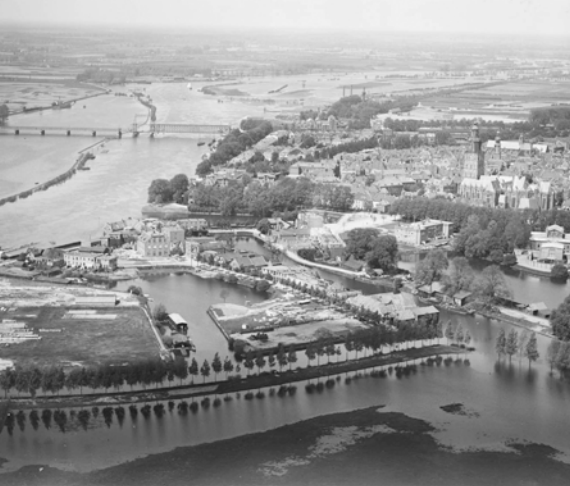
Afb. 3 Op 1 januari 1924 – de dag waarop deze foto gemaakt werd – stond het water in de IJssel (en daarbuiten) hoog. Het Hoornwerk is nog onbebouwd; rechts achter de bomen zijn huizen in aanbouw. Op de voorgrond, met de bomenrij, ligt de contrescarpwal. Geheel rechts staan nu de waterwoningen. Helemaal op de voorgrond ligt tegenwoordig de Henri Dunantweg.