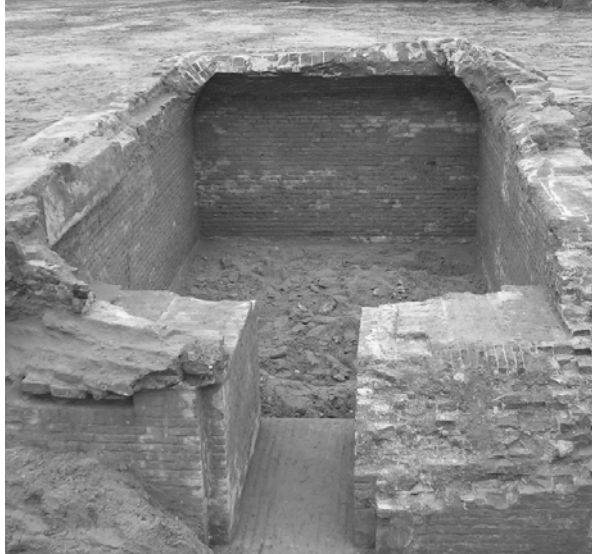
Afb. 4 De blootgelegde kruitkamer in november 2008. Dank zij doorzichtige vloerplaten is hij zichtbaar gemaakt in de parkeergarage van het appartementengebouw.

Verrassend was de vondst op het Hoornwerk van een kruitkamer, die in een opmerkelijk goede conditie bleek te verkeren (afb. 4). Deze zou worden gesloopt ten behoeve van de parkeergarage onder het appartementencomplex. Hoewel het Hoornwerk een rijksmonument is, was de gemeente Zutphen van mening dat de kruitkamer en het aangrenzende