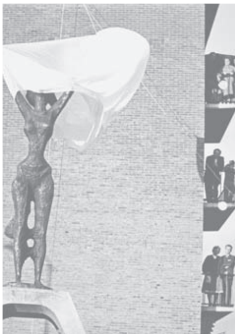
De onthulling van de staande, dynamische vrouwenfiguur.

Burgemeester De Jong gewaagde van de wetenschap dat men de eigen problemen moet oplossen. Dat heeft de beeldhouwer in de staande – dynamische – figuur willen uitdrukken. De liggende – statische – figuur symboliseert het verleden, dat de opbloei mogelijk maakte.