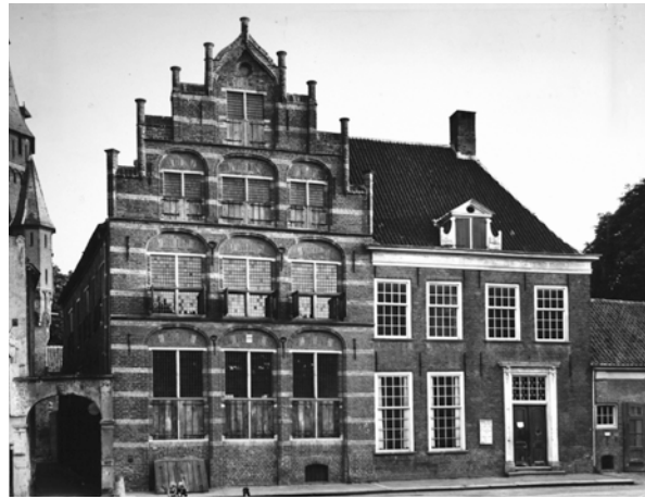
Het pand Zaadmarkt 110-112, de eerste aankoop van het Wijnhuisfonds in januari 1938.