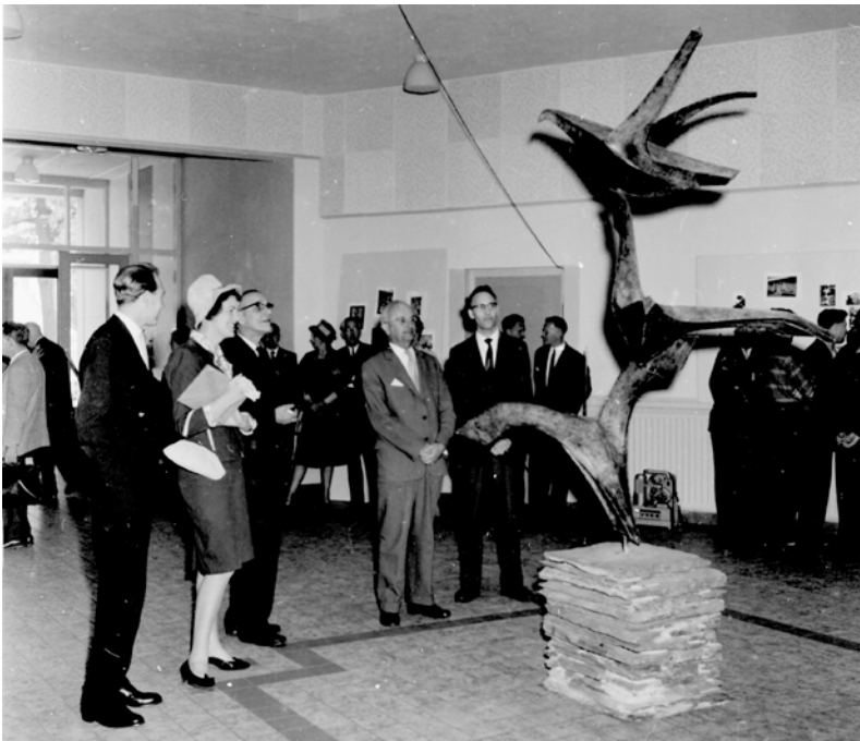
Drie vogels op een sokkel van lagen Noorse leisteen vormen het symbool van de uitvliegende schooljeugd.