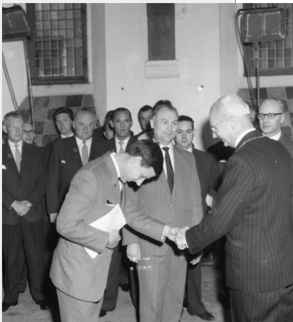
De ontvangst van de Duitse zangers in de Burgerzaal.

ook al tijdens het concert veel bijval had verworven door het zingen van een tweetal negro spirituals. Het Wir wollen niemals aus einander geh'n was hét lied van dit feest, een melodie welke men van alle kanten horen kon, toen de feestgangers na dit zeer geslaagde festijn huiswaarts keerden.