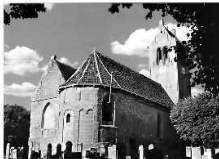
Hervormde kerk van Rinsumageest (vóór de restauratie)