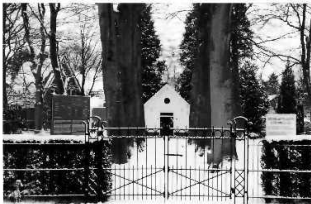
Toegang begraafplaats Eperweg 22