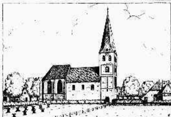
Reconstructie oude dorpskerk na uitbreiding 1540

De zware ongeveer 20 m hoge toren werd vermoedelijk later aangebouwd, zoals dat bij vele dorpskerken het geval is geweest. De gevels van deze nog grotendeels bestaande toren waren ook niet vlak zoals die van de kerk, maar met verticale en getande horizontale geleidingen uitgevoerd.