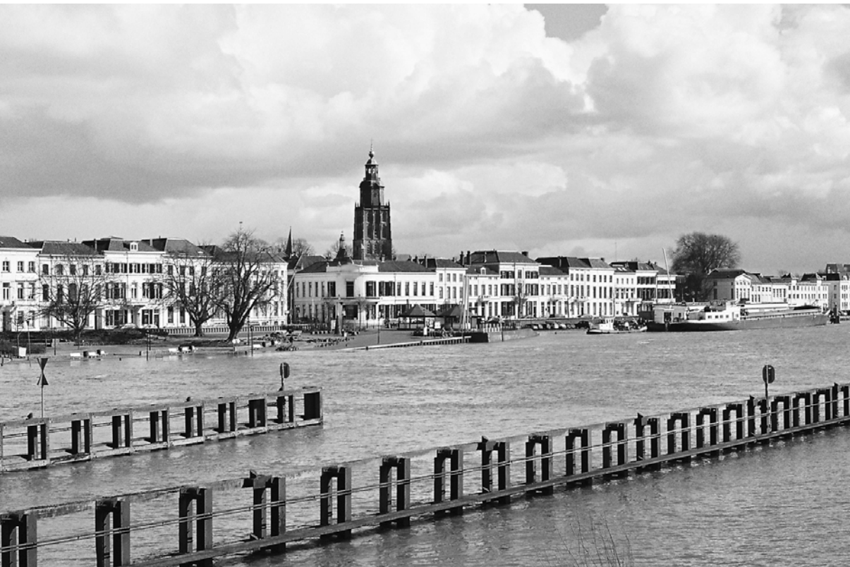
'... gelukkig, de stad is er nog'

'Ja, omdat het "gewoon" een historische stad is. Je komt het verleden bij wijze van spreken op iedere straathoek tegen. Zutphen heeft een historische sfeer. Als ze maar niet doorslaan: als ze maar geen replica's gaan bouwen. In de trant van: hier stond vroeger een poort en die gaan we reconstrueren. De vraag is steeds: moet je de historie de historie laten, of kun je er ook iets nieuws tussen