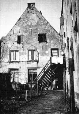
De achtergevel van het pand Laarstraat 118 vóór de restauratie in 1955.

er geen kosten voor verandering voor de eigenaar'. Ook over de ruiten is heen en weer geschreven. De secretaris van het Wijnhuisfonds schreef dat in de achtergevel zich 'een drietal soorten ruitverdeling' bevindt. 'Is het', schreef hij, 'niet aardiger om de eerste verdieping op dezelfde wijze te behandelen als gelijkvloers, of hebt u de eerste verdieping gelaten zoals zij is omdat het oude behouden kan blijven?'