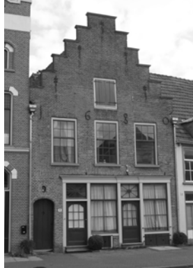
Het pand Laarstraat 118 anno 2008.

Informatie over een pand krijg je niet alleen door naar het hout en de stenen te kijken, maar ook door in het archief te zoeken. Uit archiefonderzoek bleek dat in 1678 een 'ledige huisplaats' is verkocht aan Isaack Hugen. Daarbij is het volgende vastgesteld: 'De koper zal een gang naar de put en van de hof maken, minstens 3½ voet breed.' Dat verklaart het gangetje. Een ledige huisplaats is doorgaans een stuk braakliggend terrein waarop eerder een huis heeft gestaan. Ook blijkt dat het jaartal 1680 goed is. Het is mogelijk dat er een restant van een huis, een muur mischien, nog stond; een rest van een kelder, of zelfs