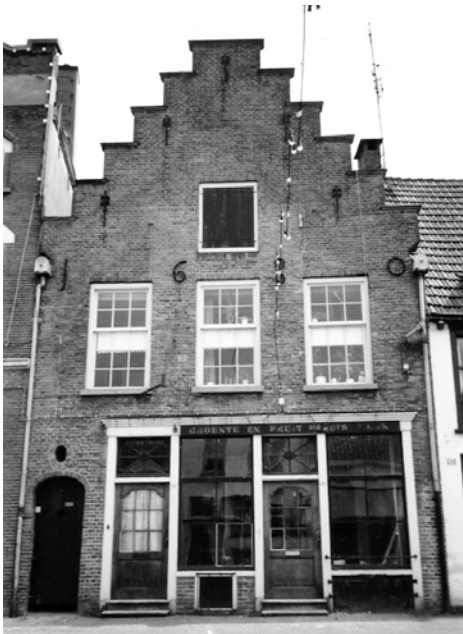
Laarstraat 118 zoals het er in 1988 uit zag.

Het bleek een zeer interessant pand. De plattegrond is rechthoekig met een korte zijde aan de straat. De gevels aan de straatzijde en aan de tuinzijde zijn topgevels. Er is een voorhuis en een achterhuis te onderscheiden, waarbij het voorhuis tweederde van de ruimte in beslag neemt. Het voorhuis is onderkelderd, het achterhuis niet. Opmerkelijk is ook een smalle gang van de straat naar de tuin. Het poortje naar dit gangetje hoort onmiskenbaar bij de gevel; het is er niet naderhand ingehakt.