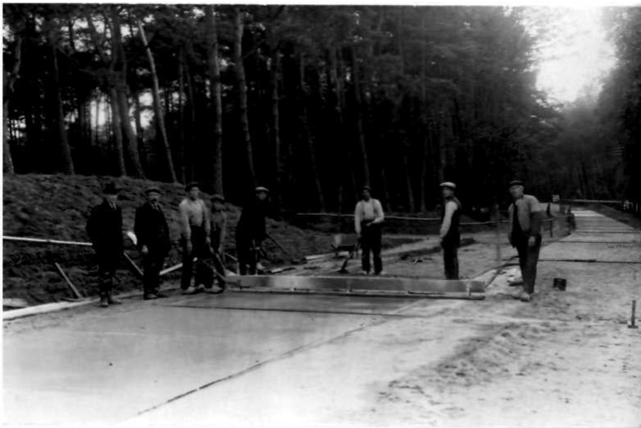
Aanleg van betonweg Elspeterweg

bewerken van het land moest uiteraard wel na werktijd uitgevoerd worden.