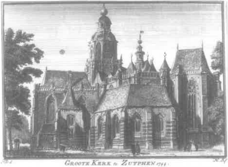
Afb. 1: Sint Walburgiskerk, 1744, gravure van H. Spilman, met rechts de Raadskapel

gedateerd op 1393 Is dat juist? Dit onderwerp ligt hier en daar gevoelig, omdat het antwoord niet simpel te geven is met ja of nee. In het algemeen kan gezegd worden dat de kerststijl 8 in de Nederlanden is gebruikt tot het einde van de twaalfde eeuw. In de veertiende eeuw duikt de kerststijl weer op, zij het dan in hoofdzaak in Utrecht en rond Luik. Fruin wijst er in zijn Handboek der chronologie 9 op dat alleen de toevoeging a nativitate achter het jaartal zekerheid geeft ten aanzien van het gebruik van de kerststijl. In het overzichtelijke boekje In tijd gemeten van C.C. de Gloppe-Zuiderland wordt dit bevestigd. De auteur wijst erop dat het vooral pauselijke kanselarijen zijn die de kerststijl gebruiken. De meeste Duitse bisdommen en het bisdom Utrecht volgen daarin, met dien verstande dat van het midden van de tiende eeuw tot ongeveer 1280 andere jaarstijlen in