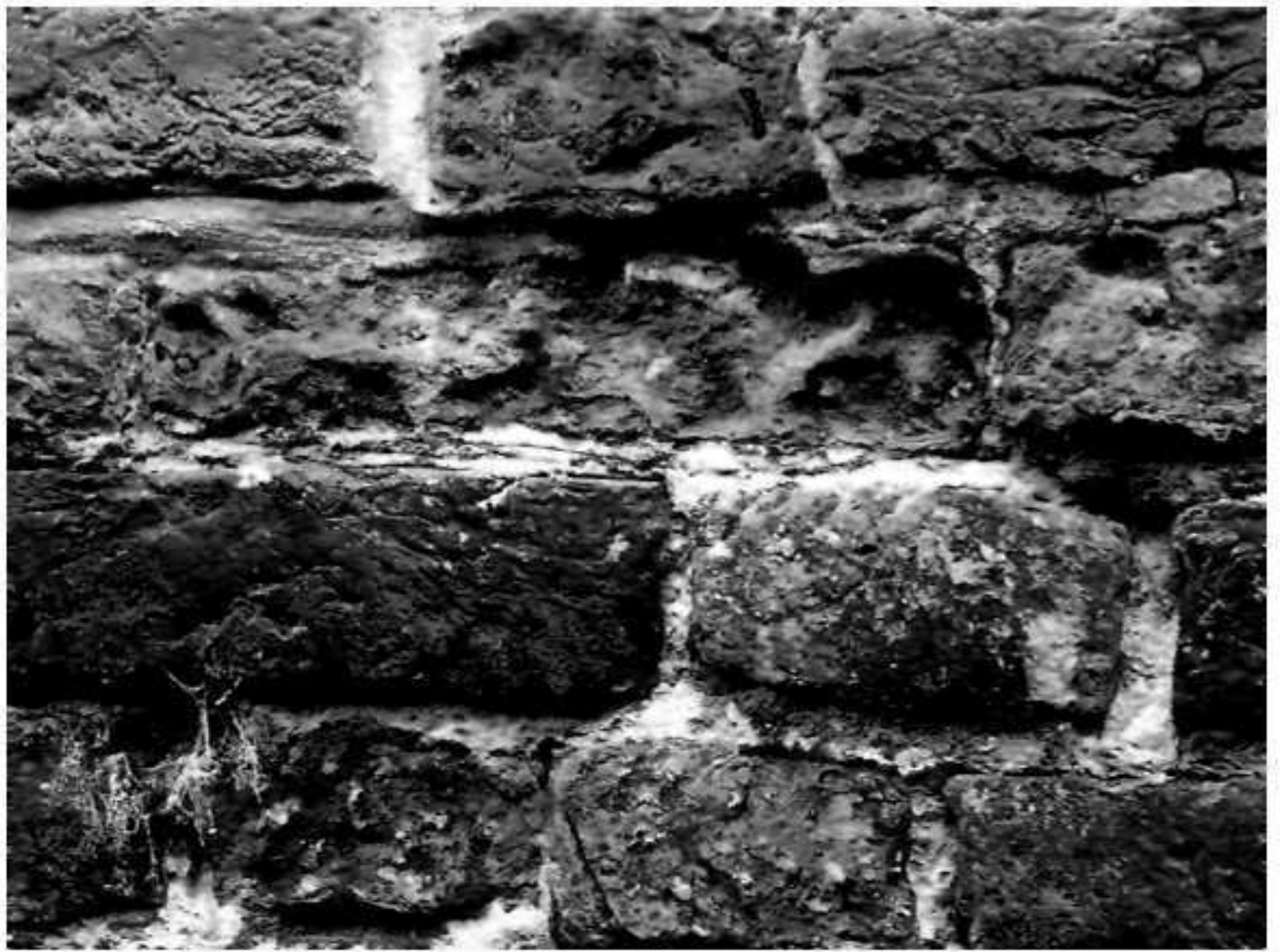
Detail muur NH Kerk aan de Dorpsstraat te Nunspeet opgetrokken uit handgevormde kloostermoppen.

of van tufsteen uit de Eifel in Duitsland. De bezwaren van deze materialen waren duidelijk: hout was brandgevaarlijk en tufsteen was duur door de hoge transportkosten. De grote kloostermoppen waren goed van kwaliteit en minder prijzig en zo is de eerste stenen kerk in Nunspeet, waarschijnlijk in deze periode, van dit product gemaakt. De toren is later bijgebouwd.