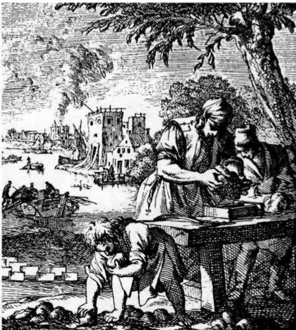
De met de hand gevormde kloostermoppen hadden een afmeting van 30 x 15 x 7,5 cm.

Bovendien had een kerktoren een uurwerk en klokken. Het luiden van de klokken bepaalde de dagindeling van de dorp- en stadsbewoners: de aanvangstijd van het werk, het tijdstip om te gaan schaften en wanneer je naar de kerk ging bijvoorbeeld. Bij rampen en overstromingen vertelden de klokken dat er iets bijzonders aan de hand was. Zo speelde ook de Nunspeetse toren vroeger in het dorpsleven een belangrijke rol en de Nunspeters waren dan ook gehecht aan de toren die generaties lang het gezicht van het dorp bepaalde.