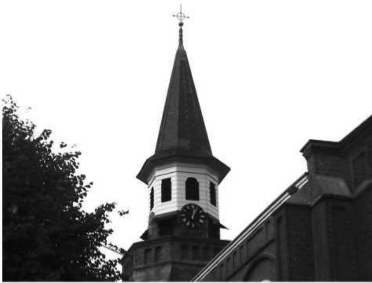
Kerktoeren NH Kerk aan de Dorpsstraat te Nunspeet voorzien van nieuwe leidekking in 2006.

werden rieten kappen in het centrum van het dorp verboden. Tegen het einde van 1855 was de Dorpsstraat hersteld en had "in uitwendig aanzien gewonnen" volgens het gemeenteverslag. Plannen werden gemaakt voor een nieuwe kerk en toren. De toren was tijdens de brand onderverzekerd en de nieuwe toren mocht dus niet te duur zijn. Ten behoeve van de torenbouw werden zelfs aandelen uitgegeven (f. 4000,- tegen 3% rente) die door de inwoners van Nunspeet gekocht konden worden. Uiteindelijk werd gebouwd volgens het ontwerp van architect Jurling uit Nijkerk.