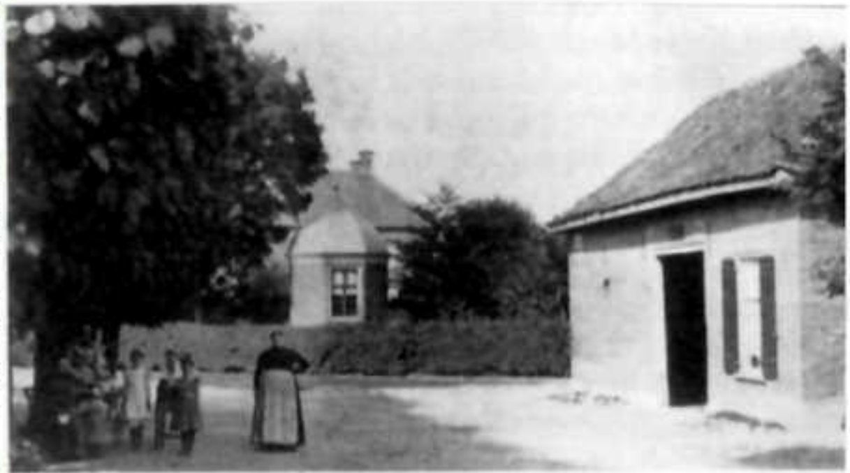
Een foto van de pastorietuin met theekoepel uit de 1e helft van de vorige eeuw.

Omdat fotoboeken per definitie foto's bevatten, kunnen de afbeeldingen niet veel meer weergeven dan beelden van personen, landschappen of panden vanaf ca. 1850. De fotografie werd immers pas in 1826/1839 uitgevonden. Voor de eeuwen daarvoor zijn we dan ook aangewezen op andere vormen van vastlegging, bijvoorbeeld door middel van tekeningen, gravures en schilderijen. Dergelijke topografische afbeeldingen of portretten werden vroeger dan ook veel meer gemaakt dan vandaag de dag. Nog in de 19 e eeuw nam het tekenonderricht een belangrijke plaats in het onderwijs in. Dat is heden ten dage helaas niet meer het geval en –eerlijk is eerlijk– het is natuurlijk ook veel gemakkelijker om een (digitale) camera of videorecorder te grijpen om een beeld vast te leggen.