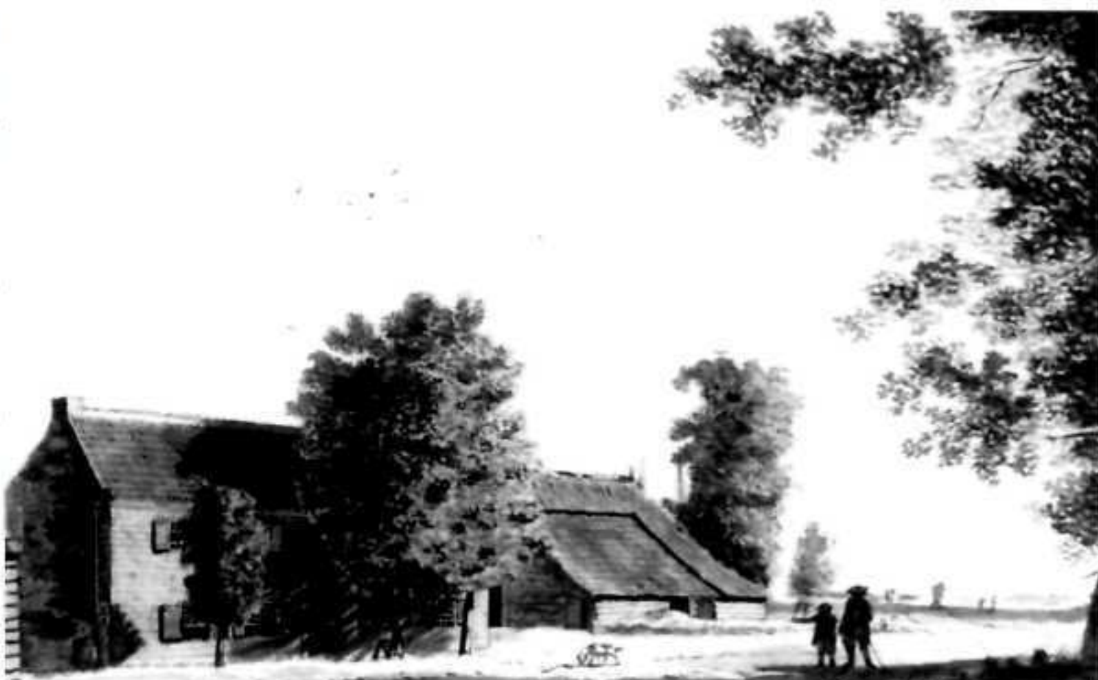
"Posthuis bij Voorthuizen", door C. van Achterbergh naar Jordanus Hoorn, 1786.

"Barneveld is een fraai, volkrijk en aanzienlijk Dorp: de Hoofdplaats van een bijzonder Schoutamt. Het heeft steenen straatwegen: en is, van een groote uitgestrektheid: onder zich hebbende, verscheidene Buurtschappen; die verre van elkander verstrooid liggen: als het Wold; Essen; Wessel; Esveld; Hasselaar enz. Ook ziet men daar verscheidene Adellijke Huizen: als Hakfort; het