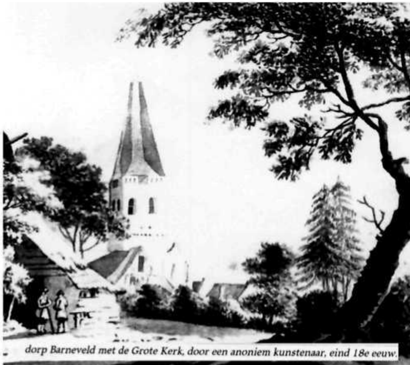
dorp Barneveld met de Grote Kerk, door een anoniem kunstenaar, eind 18e eeuw.