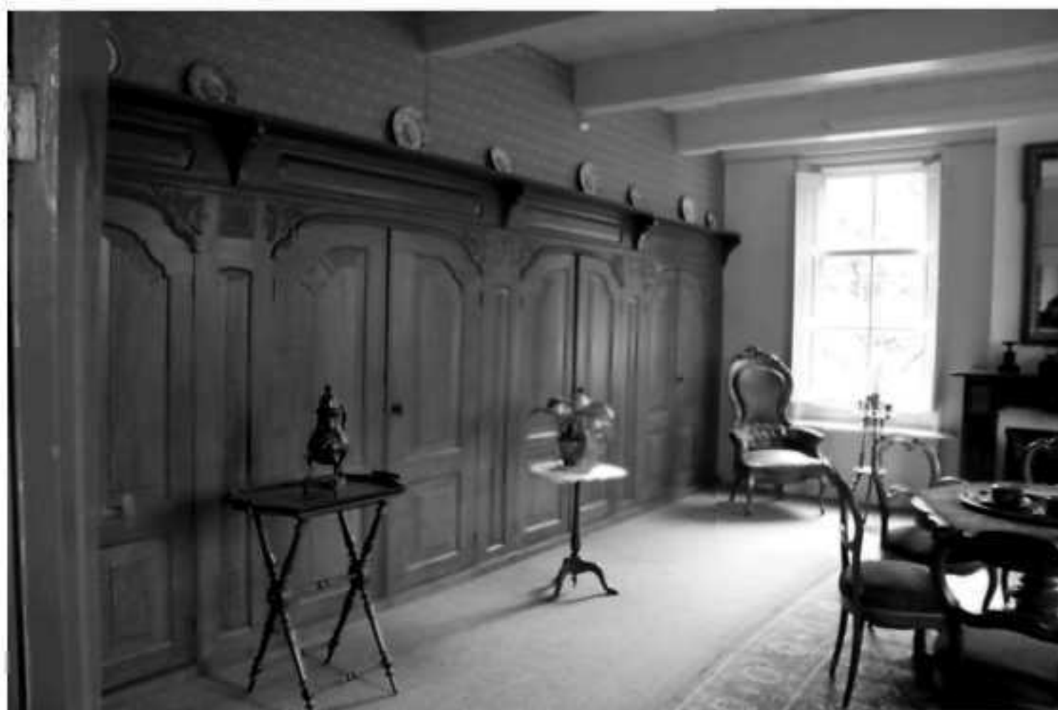
Woonvertrek met eiken bedstede in boerderij uit het Oldambt.