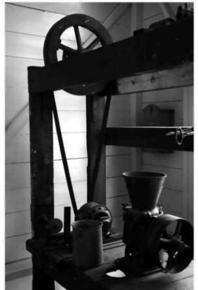
Verfmolen, mechanisch aangedreven, in het openluchtmuseum in Enkhuizen.

behulp van de verfmolen. Kleurstof, pigment, werd vermalen in de molen en vermengd met lijnolie. Hier kwam nog wat loodwit bij om de verf duurzamer te maken. Aart herinnert zich nog in zijn jonge jaren het vermoeiende draaien aan deze molen. Alleen bij grotere bedrijven werd de verfmolen mechanisch aangedreven. Later verdween de verfmolen en kregen de schilders vaten met 50 kg loodwit, zinkwit of titaanwit. Dit was een soort pasta die de schilders zelf aanlengden met lijnolie, later terpent