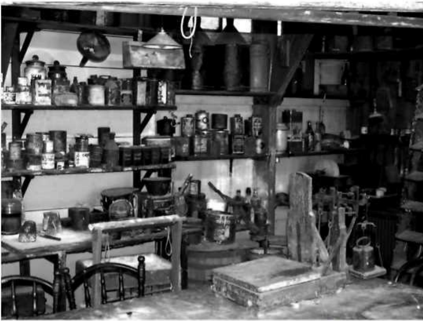
Schilderswerkplaats in het openluchtmuseum in Enkhuizen.

tine (peut). Hij vertelt: "Eén van de lastigste taken voor een schilder was het 'kleur maken'. Je kreeg bijvoorbeeld een opdracht om een huis te schilderen in de kleur die het huis al had. In de werkplaats moest je dan verf in die kleur maken voor dat huis. Dit vereiste veel ervaring."