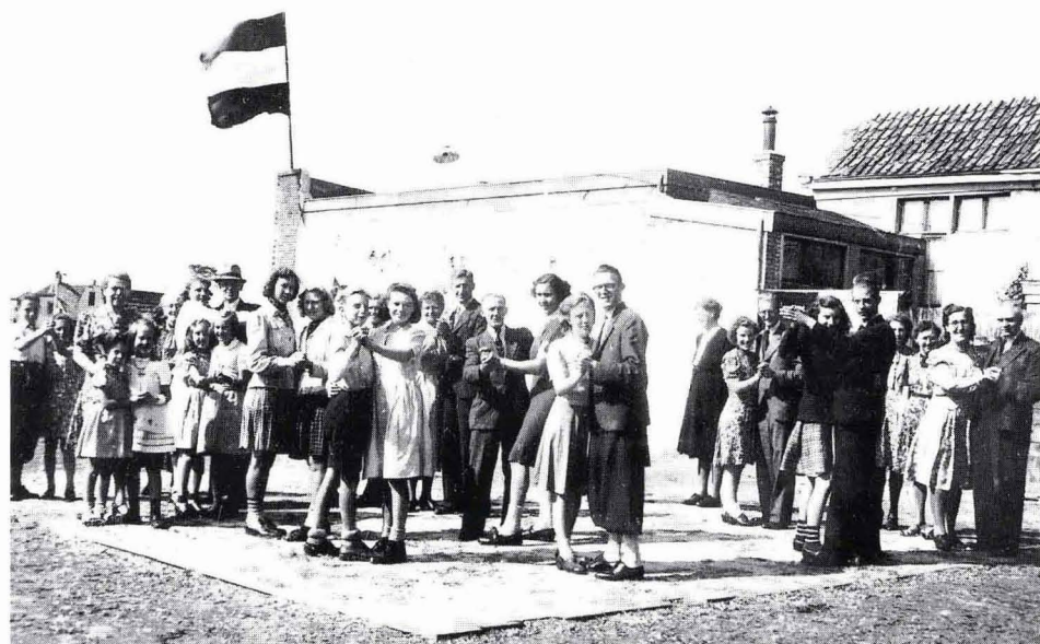
Dansende mensen hoek Brinkstraat / Rietmolenstraat . foto J.v.O.

Rietmolenstraat . De mannen (soms) met plusfour, de vrouwen (meestal) met witte sokjes. Vrolijk dansende mensen. Op de noten van... ja, van welke muziek eigenlijk? Van de radio? Of van een 78-toeren plaat die de oorlog had overleefd? Maar plezier was er. In augustus 1945. Vijftig jaar geleden.