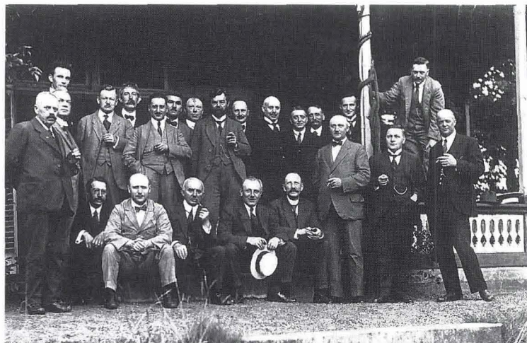
De leden der Verdraagzaamheid-Loge in 1925