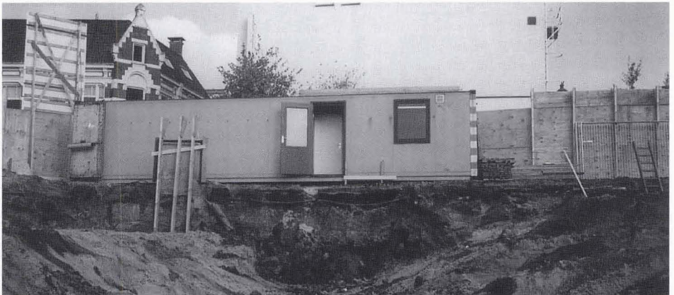
De donkere aarde van de voormalige buitengracht is goed zichtbaar, evenals de glooiende lijn; middenvoor Café De Zon