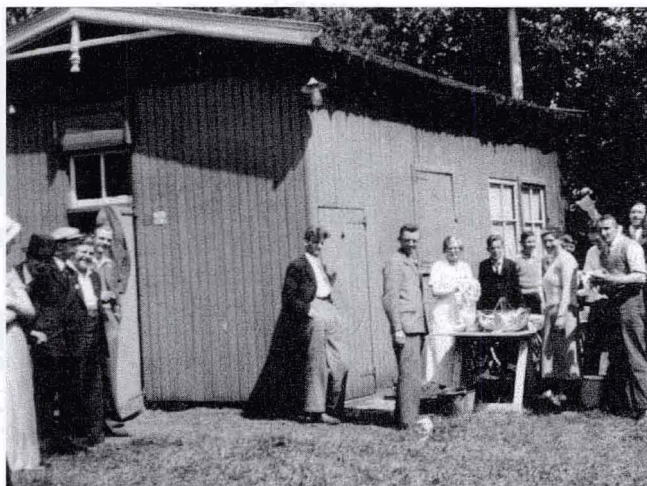
Het Lokaal achter de Kapel aan de Dorpsstraat, nog steeds in gebruik, in de jaren '40

Een zekere heer J. Weener maakte bestek en tekening voor dit eenvoudige bouwwerk. De maten buitenwerks waren vijf bij acht meter. De buitenwanden bestonden uit dubbelwandig hout, de binnenwanden uit enkel hout. Wat de kosten precies waren, is niet meer precies na te gaan, maar wel af te leiden. In een ledenvergadering van 9 april 1919 merkt voorzitter Brus namelijk op dat het gebouw verzekerd is voor f 750,-, hetwelk in dezen veel duurder tijd te laag is . Er wordt dan ook tot het dubbele besloten. Om de waarde van de gulden in die tijd recht te doen is het goed te weten dat het lokaal bij besluit van de ledenvergadering van