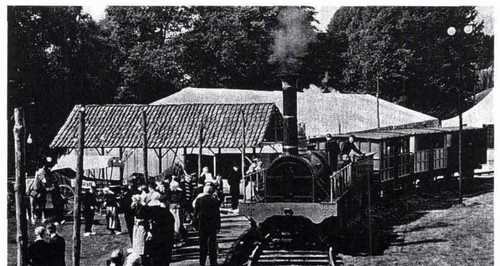
Ansichten uit de collectie van J. Sybrandi