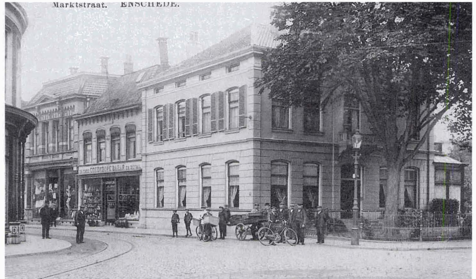
Anzicht uit collectie