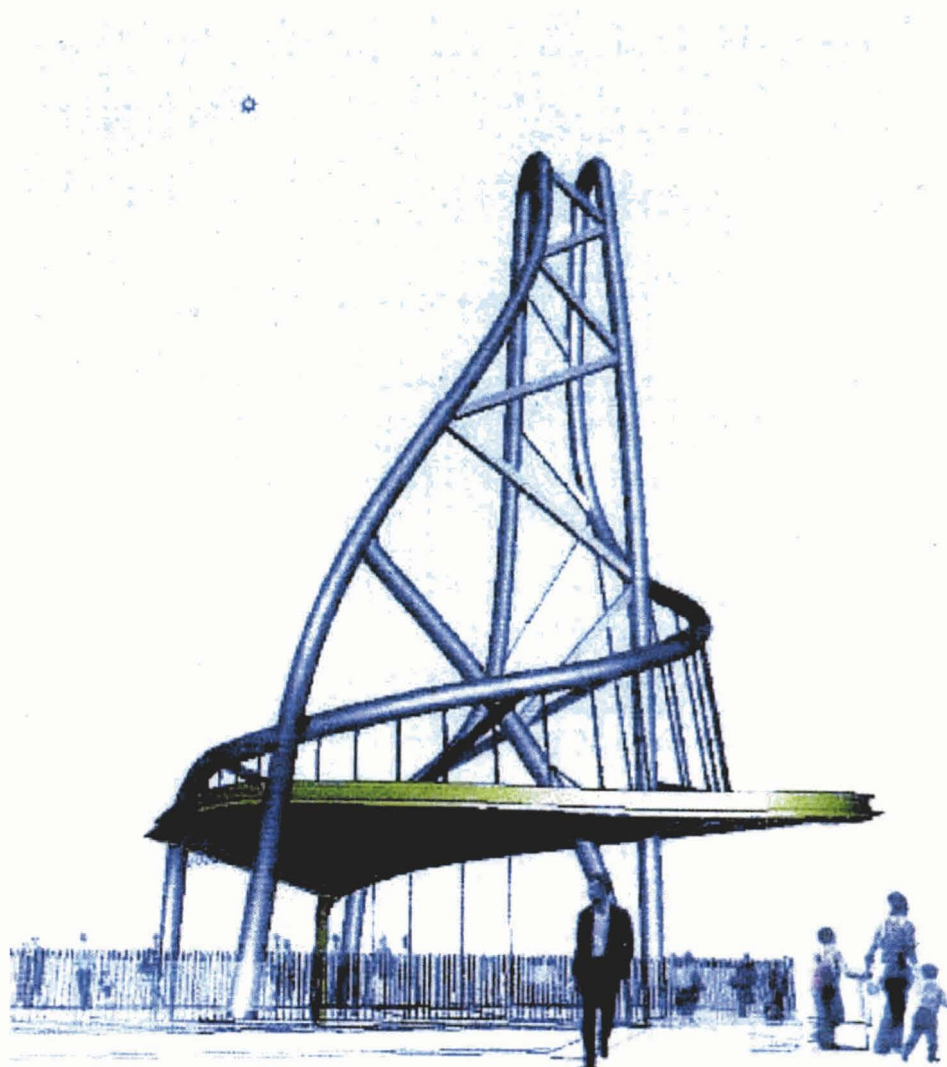
Aanzicht en doorsnede van het pleinobject.

Het plan van West 8 kent naast de overgenomen uitgangspunten uit voorgaande plannen ook een eigen filosofie. Hoewel tussen het eerste en het laatste gepresenteerde plan grote verschillen zijn, blijkt dat men een aantal ontwerpprincipes in de loop van het proces overeind heeft weten te houden. Interessant zal het zijn om uiteindelijk, wanneer het project gerealiseerd is, de balans op te maken en vast te stellen of de inzet van zoveel moeite waard is geweest. Of wat er nu op papier staat ook werkelijk aan de verwachtingen voldoet, de toets der kritiek, ook in de toekomst, kan doorstaan? Er zijn andere en roemrijke steden, die hun 'hart' verloren hebben aan de lastige bereikbaarheid van de binnenstad. Over een 'x' aantal jaren zal blijken of kwaliteit, kracht en vindingsrijkheid voldoende zijn om een vibrerende en ondanks alles toch bereikbare binnenstad te scheppen. Nu al een balans opmaken, nog voordat Enschede aan een nieuw hoofdstuk in de geschiedenis begint is nogal voorbarig.