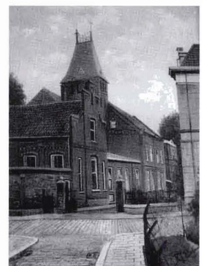
Het Larinksticht. naar een schilderij van Schoonderwoert, ca. 1920