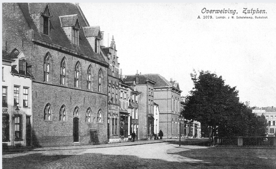
Vooroorlogse prentbriefkaart met daarop de refter en de bebouwing die bij het bombardement van 1944 verloren ging.

De zaal op de verdieping heeft een stenen vloer gekregen over de gewelven van het gelijkvloerse gedeelte, waarop estrikken – rood en blauw – zijn gelegd. Bij het herstel kwamen twee vloeren en restanten van enkele balklagen te voorschijn. Ter halve hoogte is later een zolder gemaakt; vloeren en balklaag werden verwijderd en men bracht een van eikenhout vervaardigd tongewelf aan. In de zaal aan de zijde van het dormitorium werden twee rondboogvensters (Romaans) gevonden. Bij onderzoek bleken deze te behoren tot de noordelijke muur van het dormitorium, die dus een buitenmuur was, waaruit volgt dat het huidige gebouw van de refter van jongere datum moet zijn dan het dormitorium.