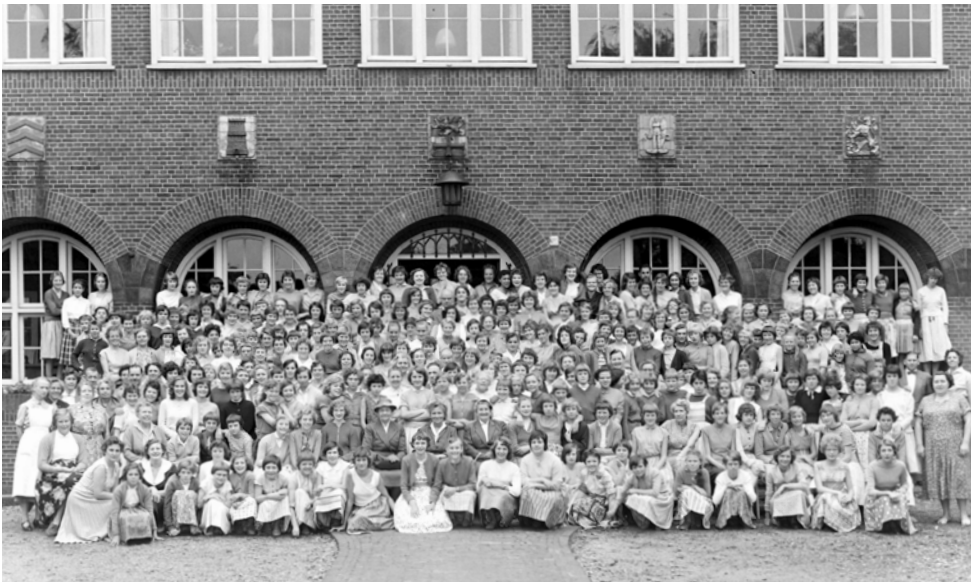
Leerlingen van de Vakschool voor Meisjes poseren op het schoolplein voor de fotograaf.