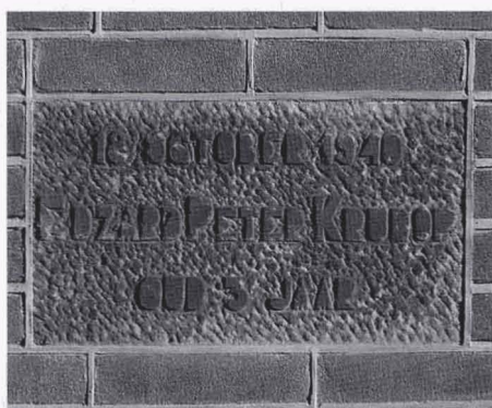
De Tetemsteen aan de Stroinksbleekweg, 2008.