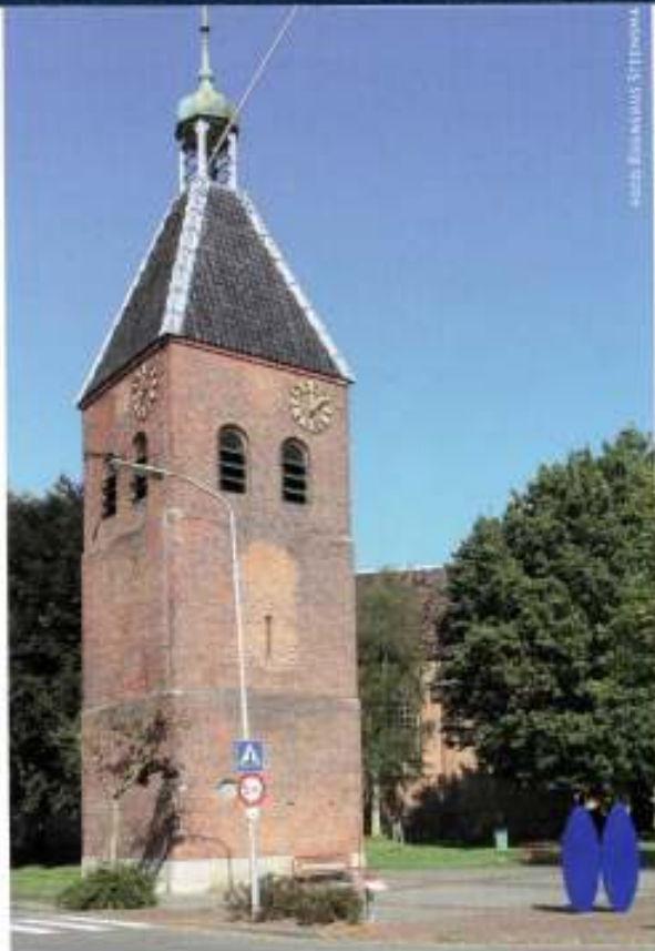
7 De klokkentoren staat los naast de kerk

In en rond de kerk liggen en staan verscheidene oude grafstenen. Pathuis beschrijft er 46 die van vóór 1814 dateren. 16 In de kerk liggen 13 stenen, de oudste van 1623 en de