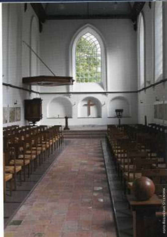
5 Interieur van de kerk naar het oosten na de restauratie

Naast de wijziging van de blikrichting werd het beeld van de inrichting sterk veranderd doordat de banken geheel werden vervangen door stoelen. Het is merkwaardig dat De Vrieze in zijn uitvoerige beschrijving van de restauratie geen reden noemt van deze ingrijpende verandering. Mogelijk vond men het herstel van de banken te duur of gaf men de voorkeur aan een flexibele inrichting. Wat