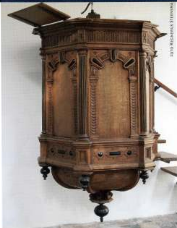
6 De fraaie preekstoel uit 1625

ninger orgelbouwer Petrus van Oeckelen en in 1961 hersteld door Mense Ruiter. 13 Het wordt in het midden bekroond door een grote vergulde zwaan met een vleugelwijdte van meer dan twee meter. Op beide zijtorens prijkt een groep muziekinstrumenten.