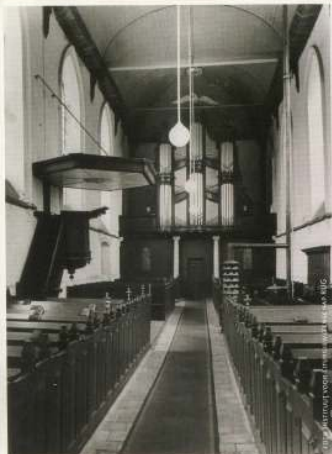
4 Interieur van de kerk naar het westen voor de restauratie