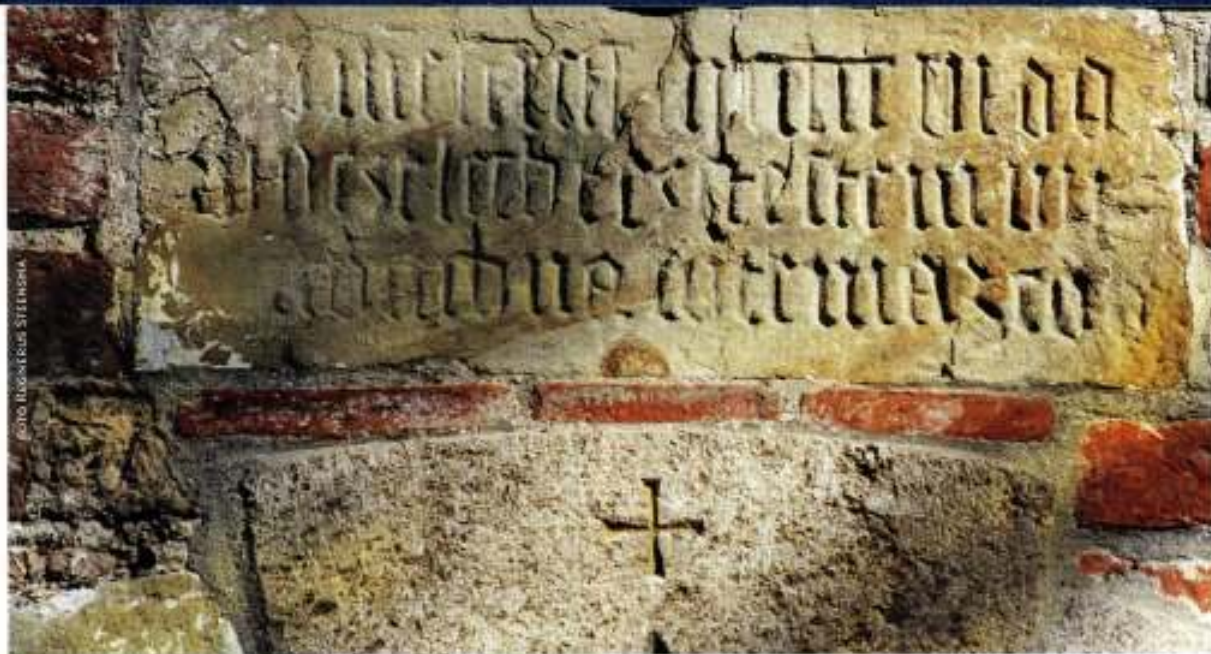
3 Gedenksteen voor de bouw van de kerk in 1506