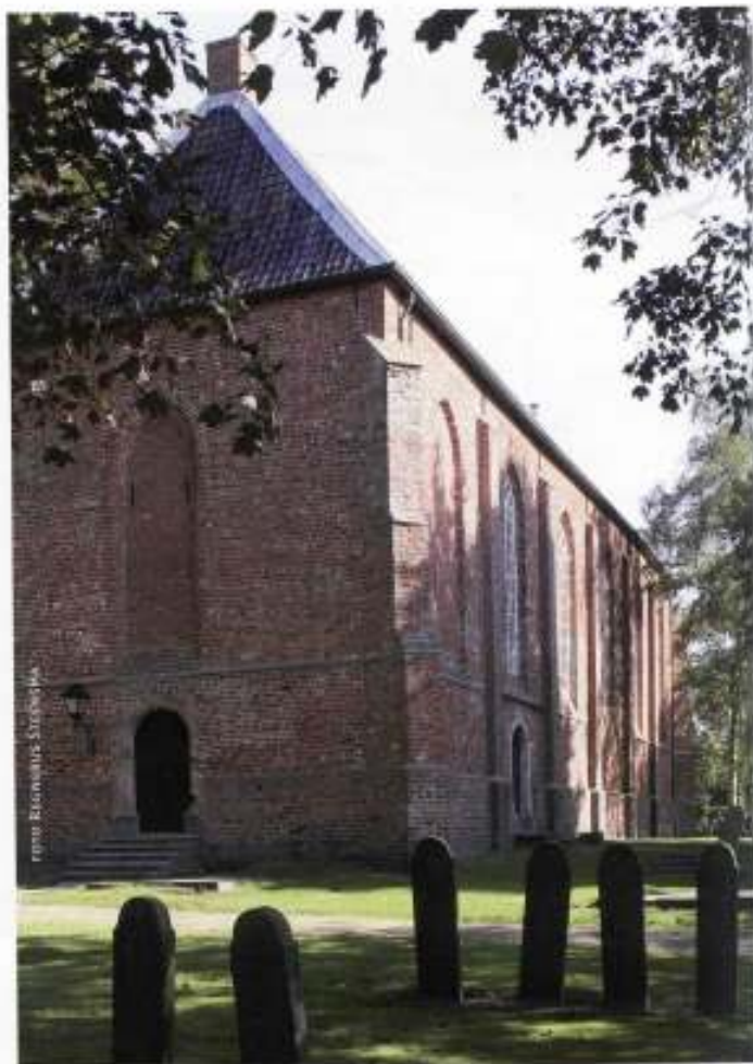
2 De west- en zuidzijde van de kerk met schiefgezakte grafstenen

Onbetwist hoogtepunt van de middeleeuwse kerkbouw in Groningen is de romano-gotiek. Na de indrukwekkende kerkbouw-hausse tussen 1225 en 1350 kwam in Groningen in de veertiende eeuw de gotiek slechts aarzelend op gang. In de vijftiende eeuw is meer bouwactiviteit in Groningen te bespeuren. Er verrezen enkele laatgotische kerken die zich kenmerken door brede hoge steunberen, die noodzakelijk waren als steun voor de kruisgewelven waarmee het interieur werd overdekt. Topstukken van de gotiek in Groningen zijn de koorpartijen van de Martini- en de Der Aa-kerk en die in Loppersum. Complete gotische kerken verrezen in o.a. in Middelstum, Ter Apel en Pieterburen. Op zich mooie gebouwen, maar niet kenmerkend voor Groningen en zonder de eigen uitstraling van de romano-gotiek. Tot die categorie horen ook enige kerken die in het begin van de zestiende eeuw rond de Dollard werden gebouwd, nadat hun voorgangers door het water opgegeven moesten worden. Dit betreft Beerta (1506), Scheemda (1515) en Bellingwolde (1527).