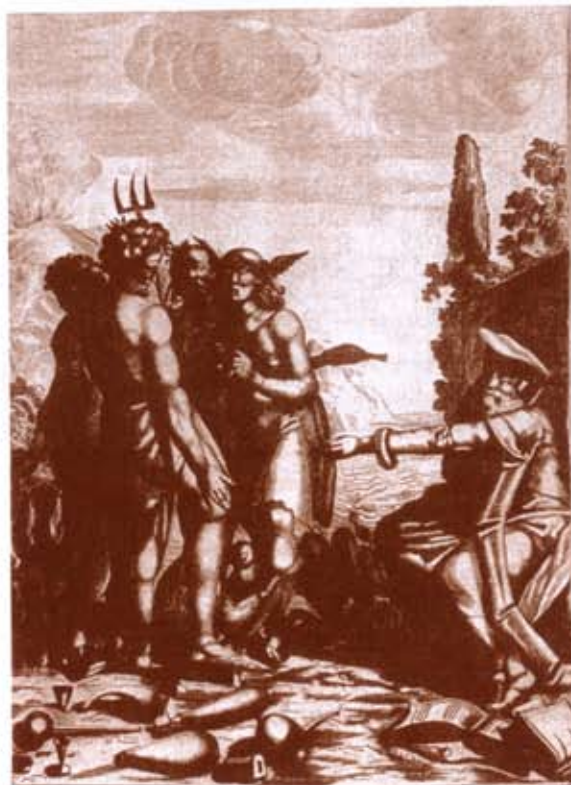
7 Gravure uit het boek 'l'Escalier des Sages' uit 1689 van Berend Coenders van Helpen. Op de voorgrond liggen diverse instrumenten en glazen die door alchemisten werden gebruikt.

Coenders, zonen van Berend, tekenden tussen 1675 en 1680. Op de rand staan 24 borgen afgebeeld, met als eerste de borg Fraam.