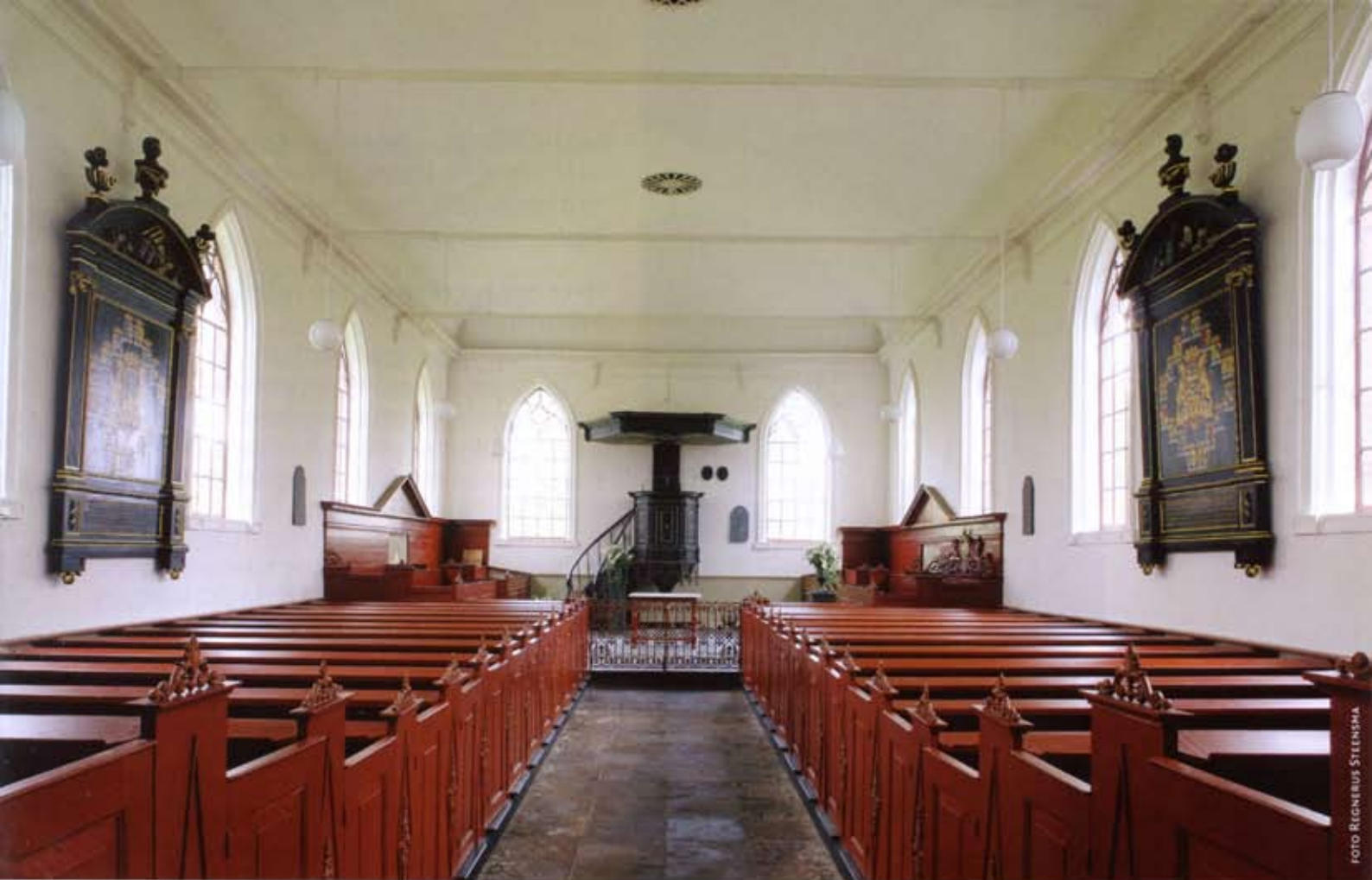
4 Interieur naar het oosten

vinden we in de kerk ook verschillende constructieve onderdelen van gietijzer. In de eerste plaats zijn dat de traceringen van de vensters met eenvoudige decoraties in de top. Verder zijn er de grote ronde roosters in het plafond van gietijzer, alsook bij de preekstoel het rooster in de onderzijde van het klankbord en dat in het achterschot.