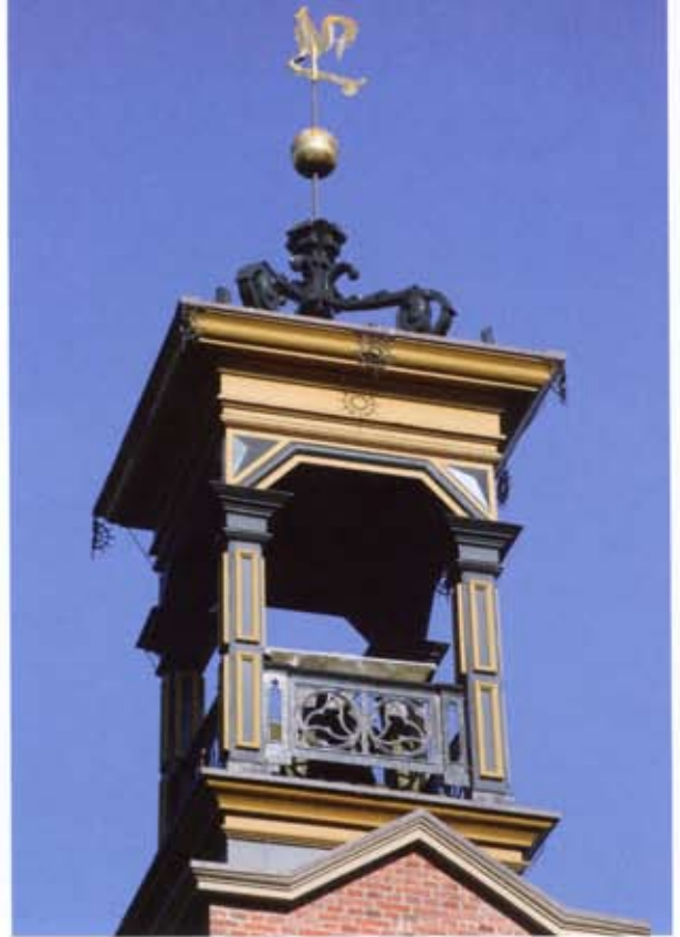
3 Dakruiter met hekwerken en bekroning van gietijzer

en kolommen. Daarnaast was dit materiaal geliefd voor graftekens in allerlei vormen. 3 In 1985 schreef Meindert Stokroos voor dit tijdschrift een artikel over gietijzeren graftekens in de provincie Groningen, zoals obeliskken, kolommen, staande en liggende grafplaten. 4