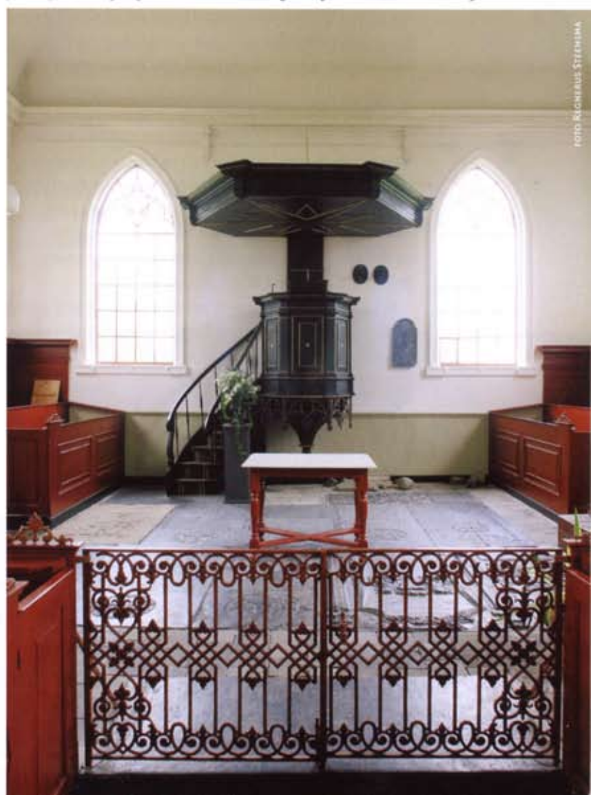
5 Doophek van gietijzer met avondmaalstafel en preekstoel, alles uit 1863