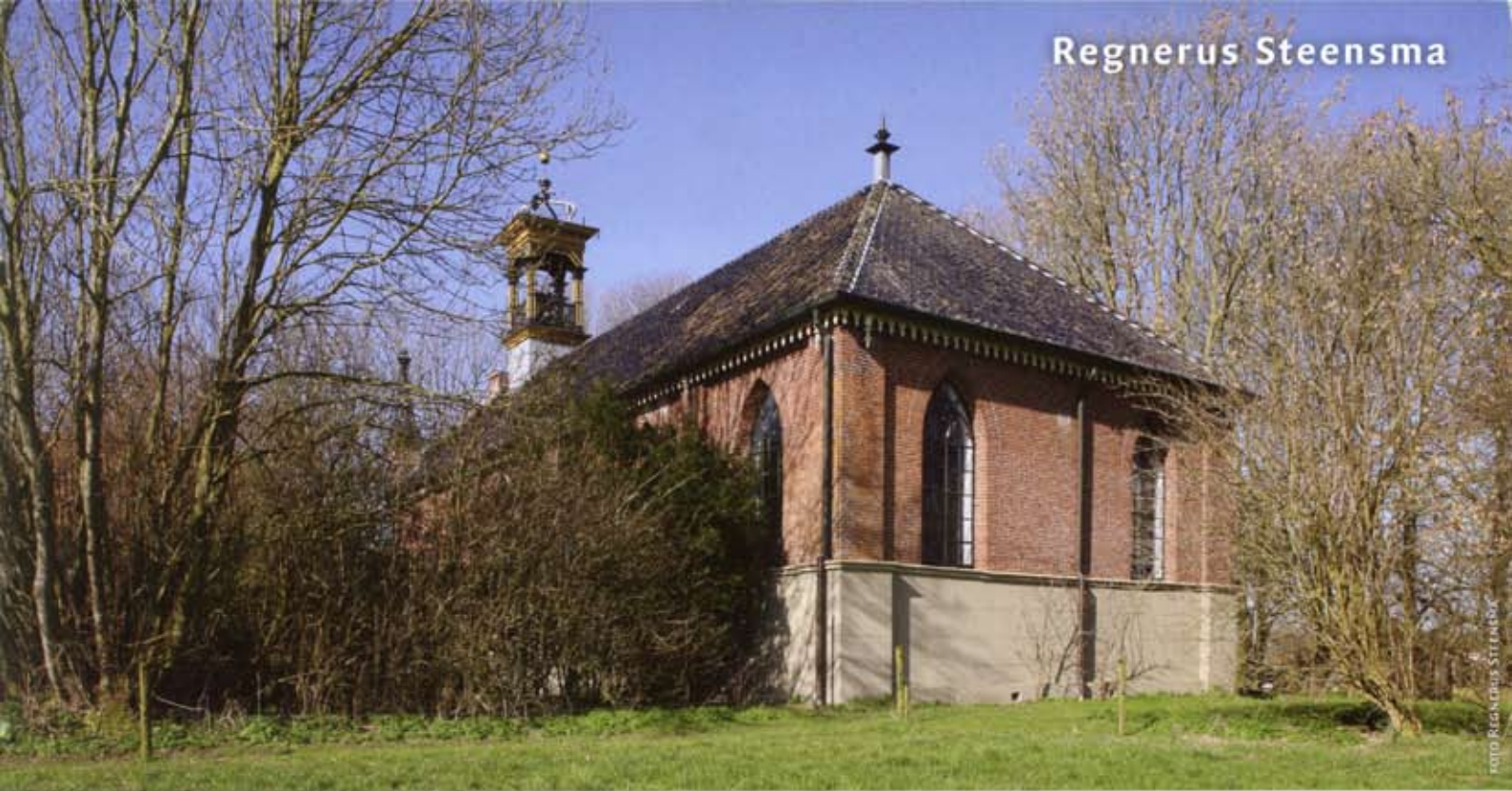
1 De negentiende-eeuwse kerk van Wittewierum gezien vanuit het zuidoosten