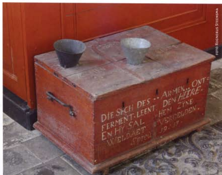
9 Offerkist met opschrift