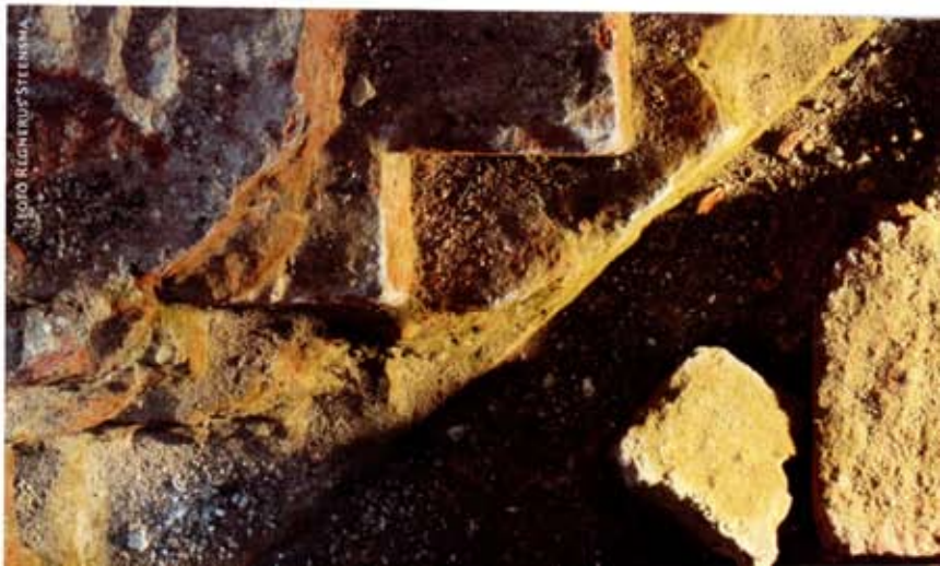
3 Bij opgravingen in 2001 werden de contouren van de dertiende-eeuwse pijlervoeten zichtbaar

de gebouwen na verloop van tijd allemaal verdwenen. Gegevens over de deplorabele staat waarin de kerk vlak na de Reformatie verkeerde kunnen worden ontleend aan een verzoek tot afbraak van het koor en herstel van de kerk uit 1599, dat wordt bewaard in de Groninger Archieven. Dominee Alardus à Berten beschrijft daarin hoe 'alle dinck verdarvet, verwaterd ende verrotten' was, 'ende dat weer ende wint daerinne slacht, also dat men kuyme van regen ende wint daerinne kan gedueren om godes woert to anhooren, want se gants dackloos is, licht open van vensteren ende doeren ende is gantsch reddeloos'. Gedeputeerde Staten verleenden daarop toestemming voor afbraak van het koor en verkoop van de stenen, mits de opbrengst hiervan werd besteed aan de reparatie van het kerkgebouw. In 1604 werd behalve het koor en de zijkapellen ook de noordelijke zijbeuk afgebroken en de arcade aan die kant dichtgemetseld, en werd de westgevel één travee naar het oosten verplaatst. Zo werd de kerk verkleind tot wat voorheen het middenschip was. In deze rudimentaire vorm bleef de kern van de kloosterkerk tot 1863 bewaard, toen ze door het huidige gebouw werd vervangen. 8 Een goed beeld van deze toestand biedt een schilderij van Sijmen Boomgaard uit 't Zandt uit 1862, één jaar voor de afbraak. Hierop is te zien hoe de vensters worden omlijst door de bogen van de dichtgezette arcade (afb. 1). Een indruk van