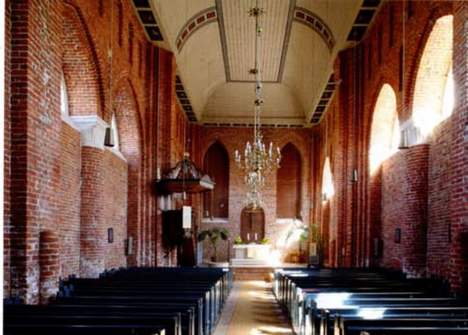
2 Marienhof, interieur van de verkleinde kerk naar het oosten