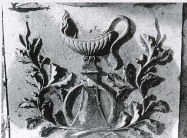
4 Reliëf van een slang die uit een olielampje drinkt

Op drie zerken in Zuurdijk vinden we de curieuze afbeelding van een slang die zijn kop heeft uitgestrekt naar de binnenzijde van een olielampje (afb. 4). Kennelijk drinkt hij de laatste olie op en helpt aldus het levenslicht te doven. Op hetzelfde kerkhof treffen we verder de voorstelling aan van een slang die naast de gepersonifieerde dood omhoog kronkelt alsmede die van een slang rond een gesloten vaas of urn. Beide zijn mogelijk een variant op de slang bij het olielampje. In de religieuze mythologie vervult de slang dikwijls een negatieve rol. Dat is niet alleen het geval in het paradijsverhaal waar de slang Eva verleidt, maar ook in de Germaanse mythologie waarin de Midgardslang een giftig monster is.