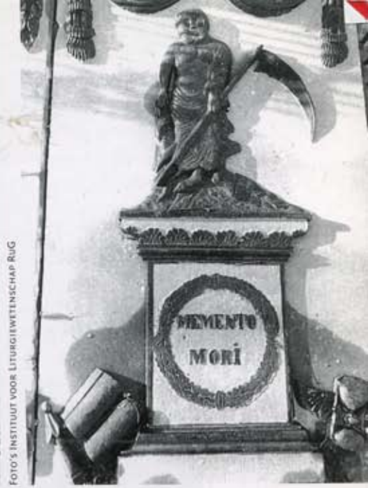
2 Grafsteen met een personificatie van de dood