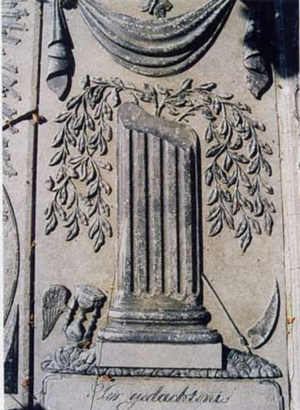
5 Een afgebroken zuil in het midden, met daarachter een treurwilg geflankeerd door een gevleugelde zandloper en een zeis

Op verschillende zerken is een oog afgebeeld binnen een driehoek waarvan een bundel stralen uitgaat (afb. 9). Het is het oog van God, waarnaar op een aantal plaatsen in de bijbel verwezen wordt, bijvoorbeeld 1 Petrus 3 vers 12: 'want de ogen des Heren zijn op de rechtvaardigen'. In de tijd van de Renaissance werd het oog vaak omgeven door een drie-