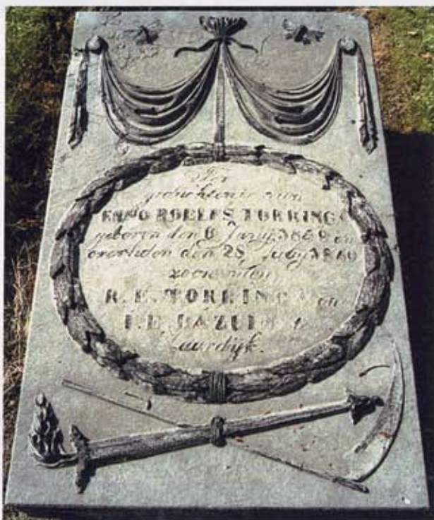
3 Opschrift binnen een lauwerkrans boven een zeis en een uitdovende fakkel