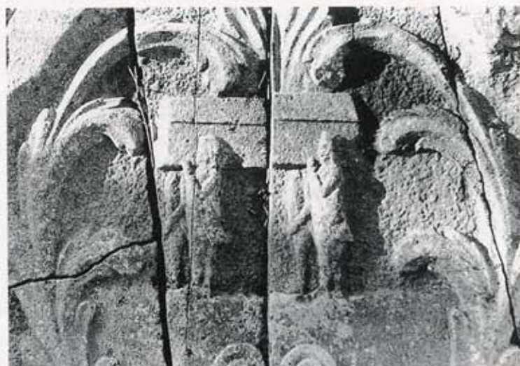
6 Begravenis met vier mannen die een kist dragen

hoek als beeld van de Drieëenheid. Dit geheel dat stralen van licht uitzendt, duidt op de heiligheid van de drieënige God.