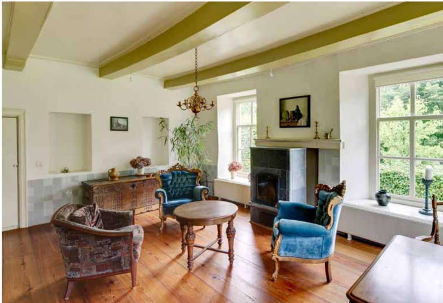
8 Overzichtsfoto van de opkamer vanuit het oosten. Dit vertrek heeft nog de oorspronkelijk vorm uit de bouwtijd.

Op basis van de kerkrekeningen kan worden geconcludeerd dat in het derde kwart van de zeventiende eeuw een verbouwing werd uitgevoerd, evenals in 1802 en 1874. De bouw van een nieuwe schuur in dat laatste jaar is al vermeld; ook werd toen de gevel, die voorheen geverfd was, voorzien van een pleisterlaag. Het meest bepalend voor het uiterlijk van het huis lijkt de verbouwing van 1802 te zijn geweest. De topgevels werden toen vervangen door schilddakvlakken.