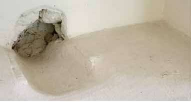
6 Een afvoergat, mogelijk oorspronkelijk een piscina, in een nis in de westmuur van de opkamer. Links de nis met mogelijke piscina.

gebouw hetzelfde bleef. Ten eerste is dat de bouw rond 1260. De hoge sael in het westelijk deel van het pand was toen de meest prominente ruimte, en besloeg circa tweederde van het huis. Mogelijk was de weem toentertijd toegankelijk via een (verhoogde?) ingang aan de westzijde. Bouwsporen hiervan zijn niet aangetroffen. Gewoond werd in het oostelijk deel van het huis. De opkamer daar heeft nog de vorm van die uit de bouwtijd, evenals de lagere verdiepingskamer. Op de zolder en in de kelder was ruimte voor goederenopslag.