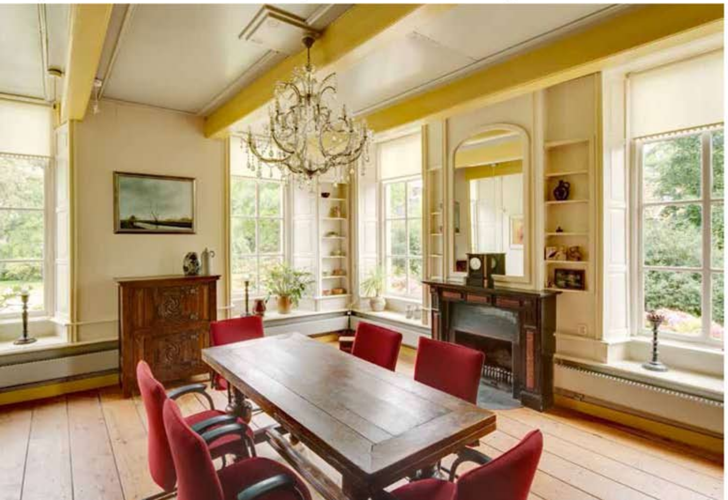
5 Overzicht van de sael vanuit het westen. De betimmering en schouw in deze ruimte dateren uit het begin van de 20e eeuw.

Globaal zijn in de weem van Eexta voor 1600 twee bouwfasen te onderscheiden, waarbij de buitenomtrek van het hoofd-