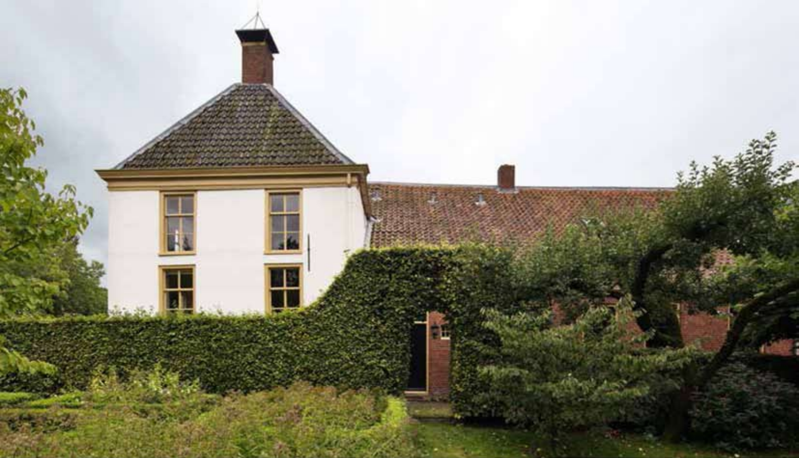
1 Voorhuis en schuur van de weem van Eexta gezien uit het noorden. De bedrijfsruimte dateert uit 1874. Enkele secundair verwerkte balken in het bouwdeel zijn dendrochronologisch gedateerd op 1465.