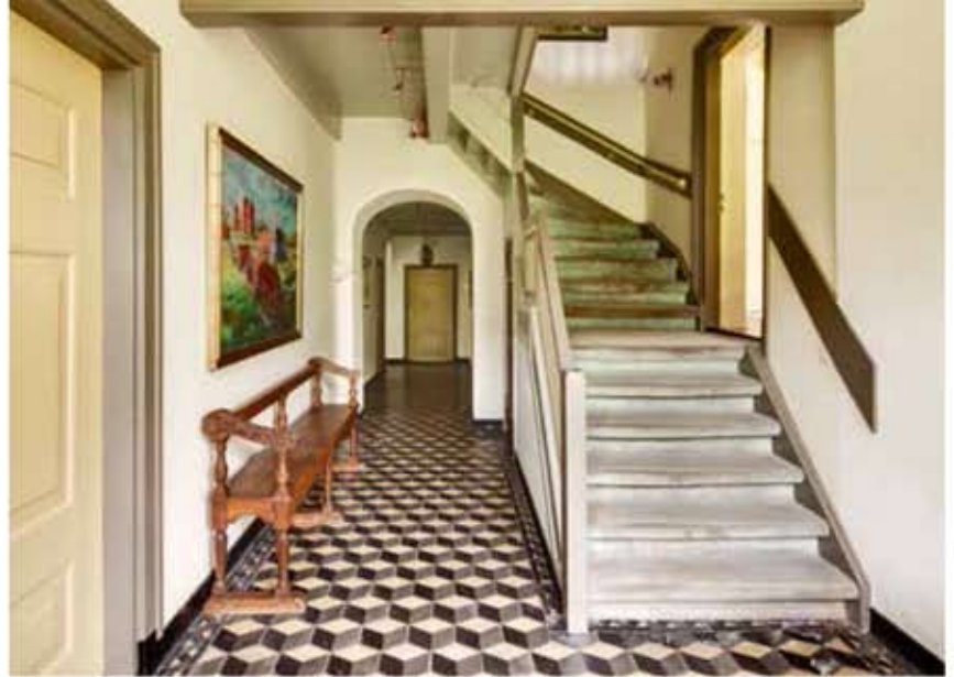
4 De gang gefotografeerd vanaf de centrale entree aan de oostzijde. Links de deur naar de 'sael', rechts naar de opkamer. De gang maakte oorspronkelijk deel uit van de sael en werd gecreëerd na de bouw van een bedrijfsgeboude, waardoor de oriëntatie van het gebouw veranderde. Mogelijk gebeurde dit in de 17e eeuw. De toegangsdeur tot de kelder, onder de trap, dateert uit dit tijdvak.

entree in de oostgevel bevinden zich een kelder, opkamer en verdiepingkamer. Links bevinden zich twee boven elkaar gelegen kamers. De onderste van deze ruimtes wordt betiteld als de sael . De zolderverdieping van het huis is ongedeeld. Jaarringenonderzoek heeft uitgewezen dat het oudste deel van de kapconstructie dateert uit 1256-1260.