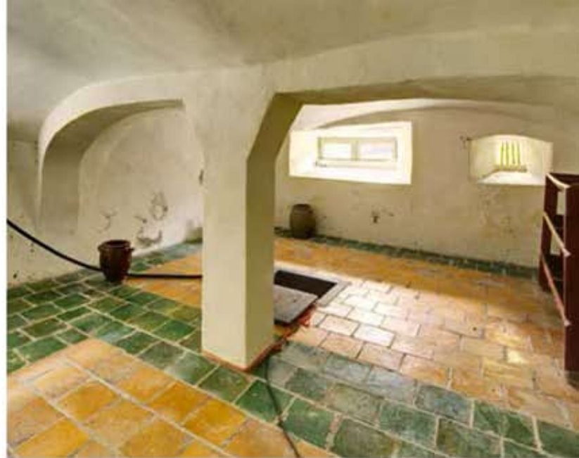
7 De kelder met 13e-eeuwse gewelven. In het midden van de ruimte bevindt zich een waterput.

Bij een verbouwing omstreeks 1516 werd de sael verlaagd. Het vertrek was daardoor gemakkelijker warm te stoken. Bovendien kreeg de ruimte erboven daardoor meer stahoogte. Het wooncomfort werd eveneens vergroot door vergroting van de oorspronkelijke spleetvensters tot 'kloostervensters' (in de lengte gehalveerde kruisvensters). Tot slot werd de dakconstructie versterkt door het toevoegen van sporen en