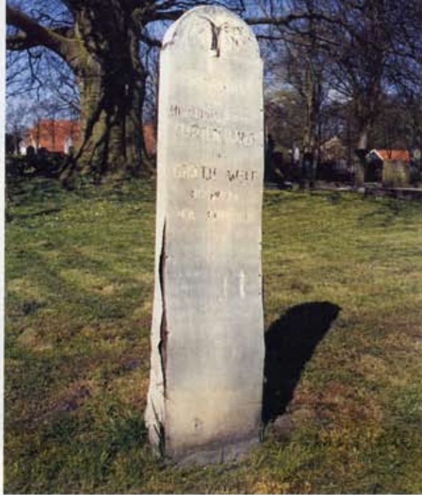
6 Een geheel met zink bekleed houten grafteken op het kerkhof van Midwolda. Tekst en boom zijn opnieuw op het zink geschilderd.

plaatsen in Bedum en Onstwedde. Een extreme metamorfose is die op de begraafplaats bij Thesinge, waar een stenen grafteken sinds kort de plaats van het houten inneemt; de originele plank bleef helaas niet bewaard en de tekst is slechts zeer onvolledig overgenomen. 3