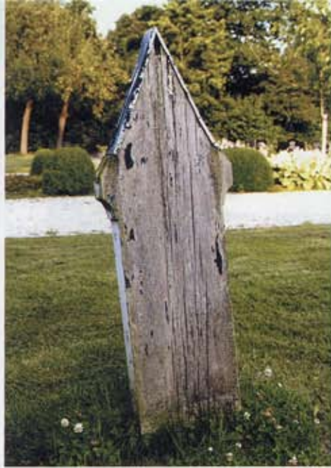
3 Grafplank met driehoekige beëindiging op de begraafplaats in Zandweer. Afdekking met een strook zink.