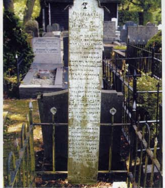
7 Langgerekte grafplank met grafvers op de Zuiderbegraafplaats in Groningen. De plank is met een strook ijzer afgedekt. Versiering met een miniem treurboompje.

Van ettelijke planken is de tekst geheel of vrijwel geheel verdwenen. De ouderdom is daarom niet meer vast te stellen. Van de met zekerheid te dateren graftekens zijn die op het kerkhof van Thesinge en een op het kerkhof van Uitwierde de oudste: beide stammen uit 1892. Het jaartal 1812 op een van de planken op de joodse begraafplaats in Leens is misleidend: het behoort 1912 te zijn. Overigens zijn bij het overschilderen van de drie planken aldaar ook nog eens twee verwisseld. 4