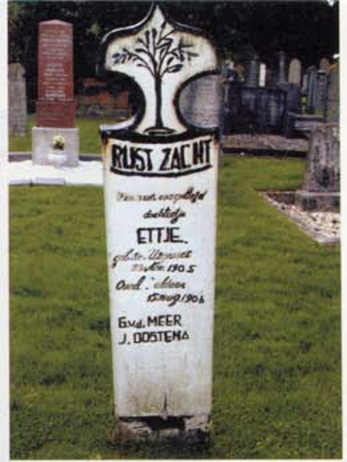
5 Een van de grafplanken met fantasierijke vormgeving op de begraafplaats in Usquert, primitief geschilderd en met een niet zo erg treurende boom.

van Engelbert tot een kriebelige cursief. De teksten worden soms door een eenvoudig ornament afgesloten, in de trant van het Engelse filet, waarmee in de typografie bijvoorbeeld hoofdstukken worden gescheiden. 1 Daarvoor werd een sjabloon gebruikt.