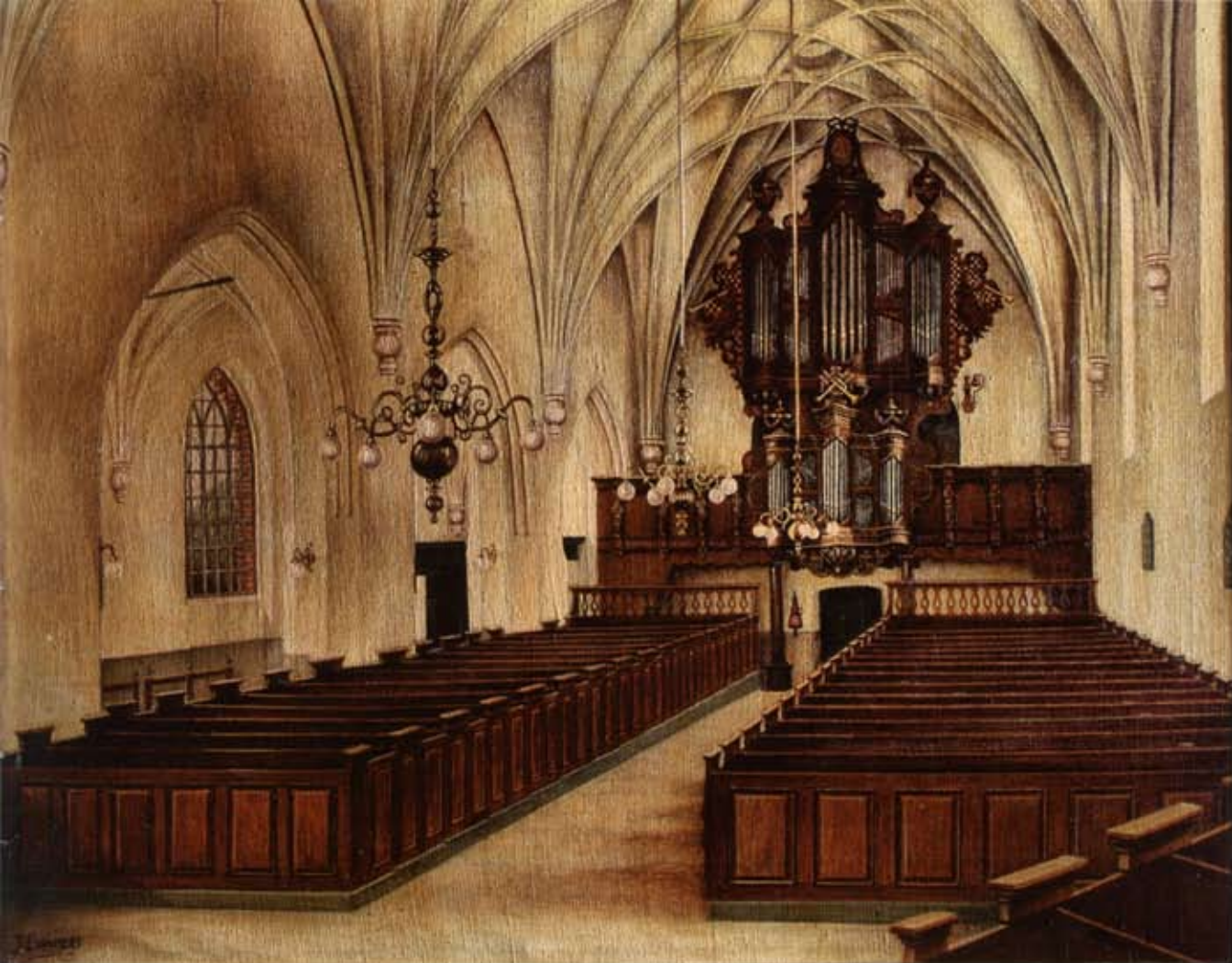
3 Het interieur naar het westen met twee lange rijen banken, in de opstelling van 1832 tot 1953 (schilderij van J. Lommert).