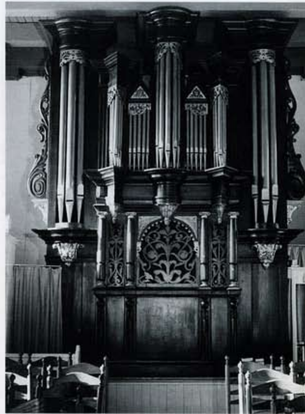
1 Het orgel in de kerk van Marum.

Betaelt aen Mons. Francois Paludanus voor 't vergulden van de drie onderste pyramiden twee capitelen; item de saterkens met den nachtegael te vergulden en te schilderen; item van de vergulde letteren van den trammelant en nachtegael te maken; als noch van de letteren en wapens, die op de friesen