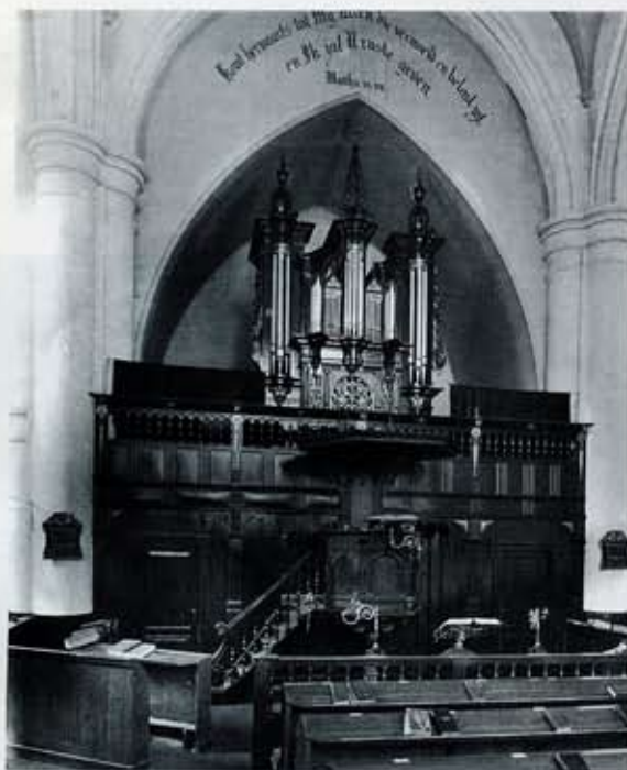
2 Ginneken, Hervormde kerk. Het tot preekkerk ingerichte koor, met het orgel in de opstelling van 1883 tot 1939 en het orgelfront zoals het door J. van Gelder is vormgegeven. Van het vroegere orgel bleven alleen de houten delen van het front gehandhaafd. Frontpijpen, zijtorens, bekroningen en een deel van het ornamentwerk dateren uit 1890.