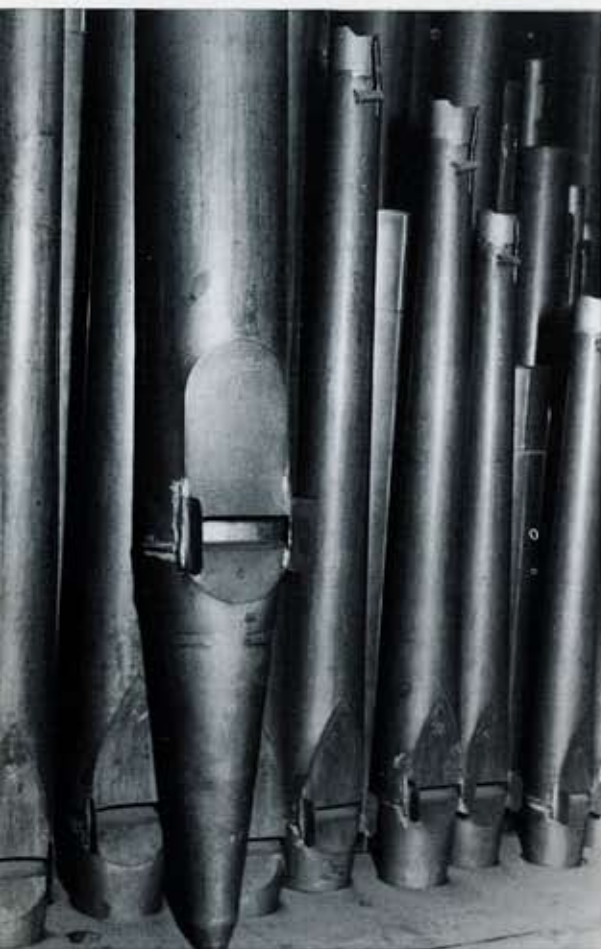
6 De kerk van Marum. Details van het pijpwerk: voor staat een pijp van de Holpijp 8 vt, daarachter pijpen van de Vlakfluit 2 vt.