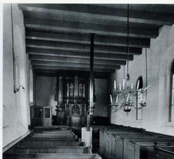
4 De kerk van Marum: interieur naar het westen voordat in 1963 de eenvoudig-gedistingeerde, laat-achttiende-eeuwse banken hoogst ongelukkig door stoelen werden vervangen.

Alle bestaande pijpen worden nagezien, gereinigd, waar nodig opgerond en hersteld, speciaal bij de stemlappen, welke breed en behoorlijk-bevestigd moeten zijn. Ontbrekende of loszittende zijbaarden zullen opnieuw worden