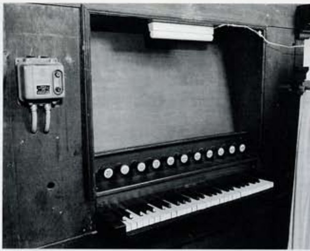
7 De kerk van Marum; klaviatuur van het orgel.