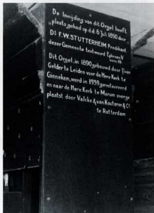
5 De kerk van Marum. Opschriften op de achterzijde van de middentoren ter herinnering aan de inwijding in Ginneken en de plaatsing in Marum.

worden gelet op heldere aanspraak der open labiaalstemmen, op draagkracht voor het gemeentegezang, en op doorzichtigheid van het geluid bij polyfoon spel.