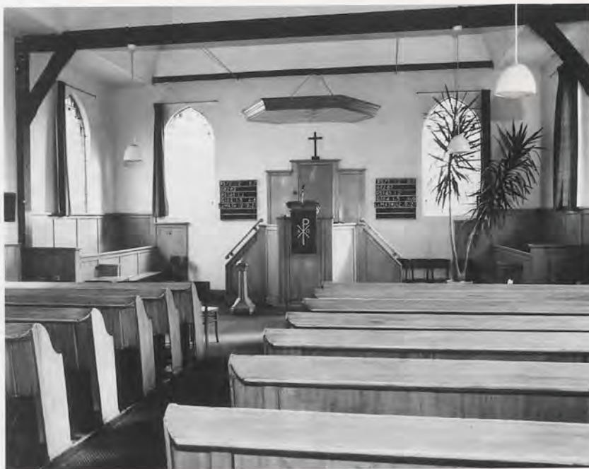
1 Het interieur van de kerk in Kiel-Windeweer, dat in 1994 geheel uitbrandde.