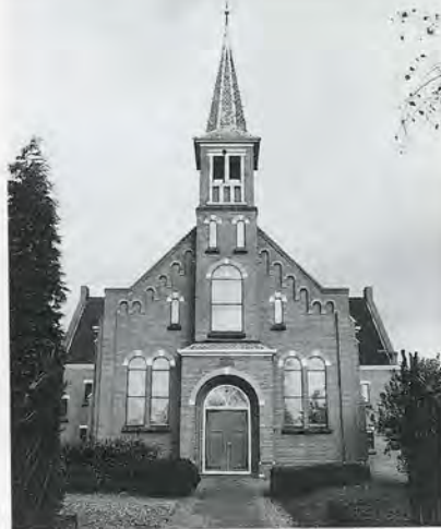
15 en 16 De kerken in Schildwolde (1911) en Siddeburen (1913), die op grond van hun overeenkomst met de kerken van Garrelsweer, Haren en Aduard eveneens aan Y. van der Veen kunnen worden toegeschreven.