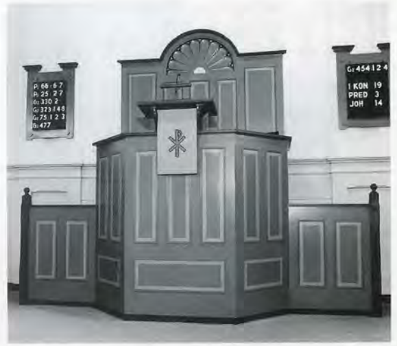
8 en 9 Achter de schrootjes die de preekstoel in de kerk in Middelstum jarenlang ontsierden, was de oorspronkelijke detaillering grotendeels bewaard: zij is in 1992 hersteld en gereconstrueerd.

onderbouw van de kansel is met zwart marmer bekleed, de vier zware kolommen en de benedenstrook van de orgelwand zijn, anders dan wij schreven, niet van marmer, maar slechts als imitatie-marmer geschilderd en, naar hij eraan toevoegt, "niet eens zo'n beste imitatie". Bij de bouw van het nieuwe orgel in 1982 is het front weliswaar aangepast, maar de onderbouw, de bastorens en al het snijwerk zijn van het orgel uit de bouwtijd van de kerk overgenomen. Vergelijking van het oude en het nieuwe front leert dat er nu een echt rugwerk is gekomen, terwijl het hoofdwerk kleinere pijpenvelden heeft.