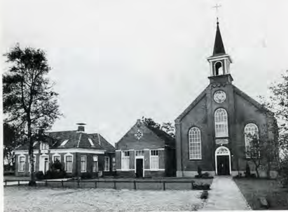
5 Pastorie (1877), consistoriekamer (1907) en kerk (1875) in Ezinge, een waardevol ensemble. Helaas is het interieur van de kerk in 1958 en later opgeofferd aan de waan van de dag.