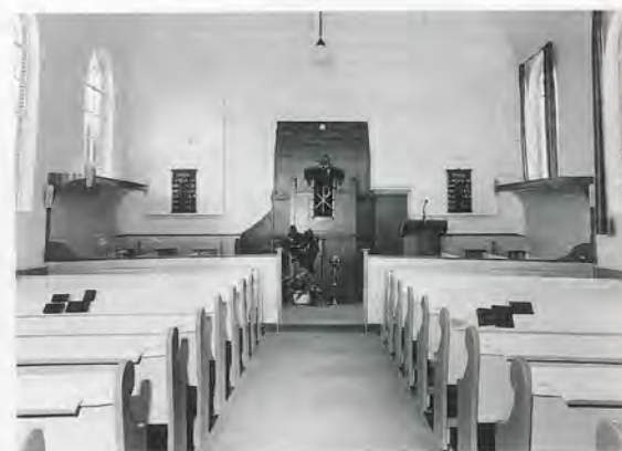
19 Het interieur van de kerk in Overschild (1879): de banken, met inbegrip van de overhulfsde ter weerszijden van de preekstoel, zijn uit de bouwtijd; de tegenwoordige preekstoel is van latere datum.