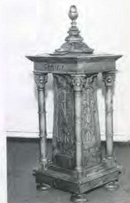
17 en 18 De doopvont in de kerk van Aduard (links) toont een treffende gelijkenis met die in Enumatil en is kennelijk in hetzelfde bedrijf in Kornhorn gemaakt: de opbouw van het geheel en het snijwerk op de panelen zijn identiek, voor het overige zijn er enige verschillen.