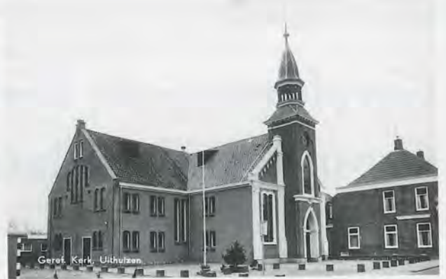
4 De kerk in Uithuizen uit 1866 met het in 1892 gebouwd dwarschip.