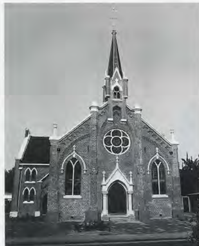
10 De nadrukkelijk vormgegeven voor-gevel van de kerk in Uithuizermeeden.

Over architect Y. van der Veen (GK 1993, p. 54, 62, 65) kan inmiddels worden gemeld dat hij ook de Gereformeerde kerk in Garrelsweer (1912) heeft ontworpen en dat hij de negentiende-eeuwse kerk van Veendam, die in de jaren zestig van deze eeuw werd vervangen (GK 1993, p. 105), heeft verbouwd. Geleidelijk aan begint zijn oeuvre niet alleen duidelijker contouren te krijgen, maar blijkt bovendien dat het ook kwantitatief omvangrijk is geweest. Zo staat van de kerk in Haren (1913) vast dat deze door Van der Veen is ontworpen. In 1961 heeft een omvangrijke restauratie plaatsgevonden door Egbert Reitsma en zijn zoon L.H. Reitsma.