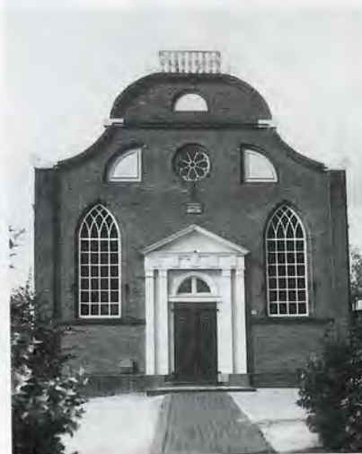
6 en 7 De uit 1868 daterende voorgevel van de kerk in Meeden met zijn schilderachtig conglomeraat van classicistische, gotische en barokke elementen is omstreeks 1975 hoogst verdrietelijk gemoderniseerd.