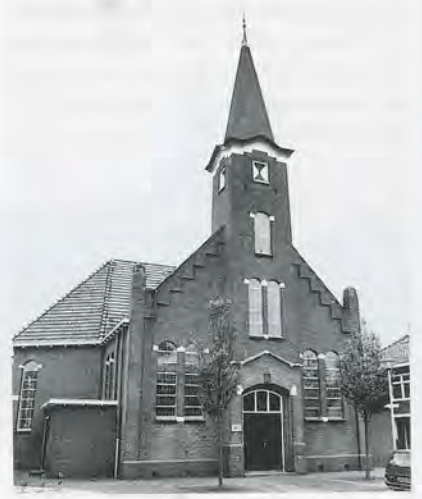
12, 13 en 14 De kerken in Garrelsweer (1912), Haren (1913) en Aduard (1914), die ook tot het oeuvre van Y. van der Veen behoren. De spits van de Harener toren is in 1961 door E. en L.H. Reitsma gewijzigd.

Bij die gelegenheid is de bovenzijde van de toren vernieuwd. De toen aangebrachte terugspringende spits roept die van Kollum uit 1925 in herinnering. Recentelijk heeft archiefonderzoek van de heer Loer het vermoeden bevestigd dat ook de kerk in Aduard (1914) onder architectuur van Van der Veen is gebouwd. Vergelijking van de kerken in Garrelsweer, Haren en Aduard en de door Van der Veen aan de kerk van Uithuizen aangebrachte wijzigingen met enkele andere kerken doet vermoeden dat ook deze aan Van der Veen moeten worden toegeschreven. Het gaat om de kerkgebouwen in Schildwolde (1911) en Siddeburen. Van dit laatste gebouw hebben we indertijd (GK 1993, p. 91) gemeld dat het in 1912 door het bureau Buitenkamp en Luxema was gebouwd, maar dit zullen veeleer de aannemers zijn geweest; het bouwwerk is overigens eerst in 1913 voltooid. Bij al deze gebouwen vinden we hoge ge-