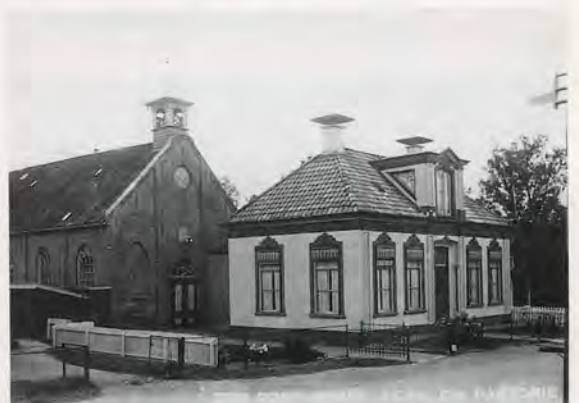
2 De pastorie en de kerk in Ten Post, respectievelijk gebouwd in 1855 en 1870. De kerk heeft sindsdien haar dakruiter verloren en de pastorie is in 1967 door een minder markant huis vervangen.